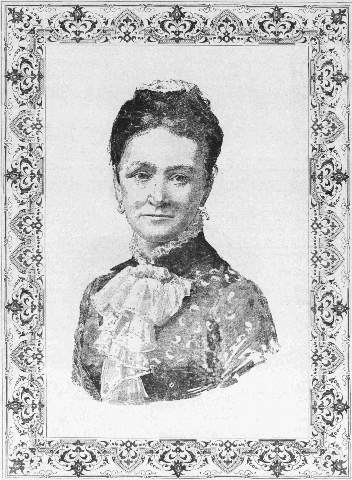
ΛΟΥΙΖΑ ΒΑΣΙΛΙΣΣΑ ΤΗΣ ΔΑΝΙΑΣ