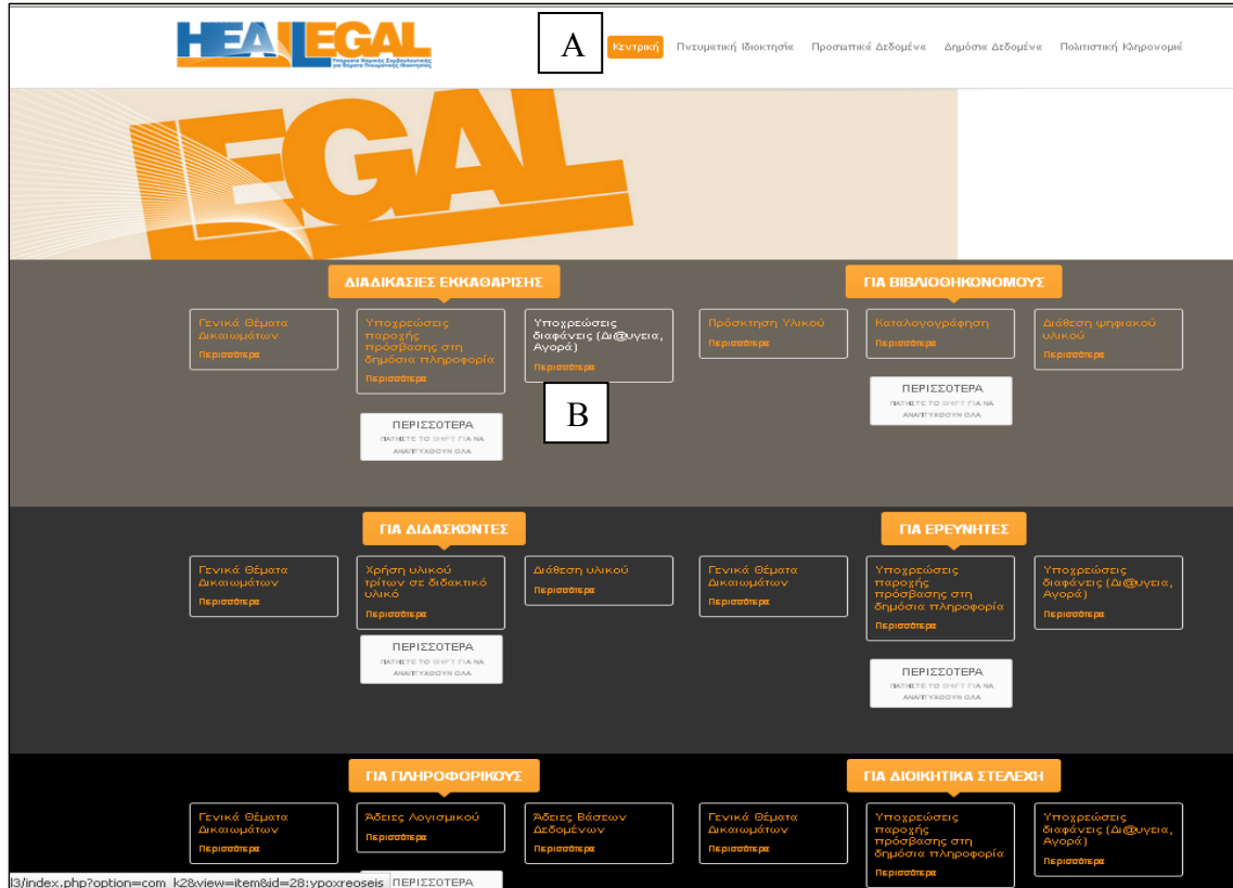
Εικόνα 6: Κεντρική σελίδα του ιστότοπου Heal-Legal