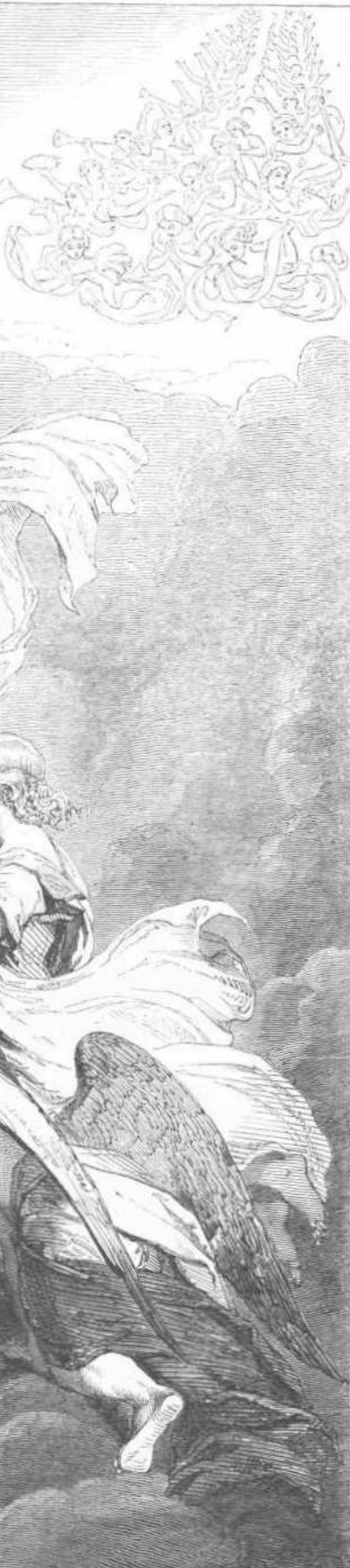
ΗΡ. ΤΙΝ.—Ο ΒΙΣΟΥΣ ΧΡΙΣΤΟΣ ΜΑΚΟΝΟΜΕΝΟΣ ΥΨ' ΑΓΓΕΛΩΝ ΜΕΤΑ ΤΗΝ ΦΥΤΗΝ ΤΟΥ ΗΙΕΡΑΣΜΟΥ.