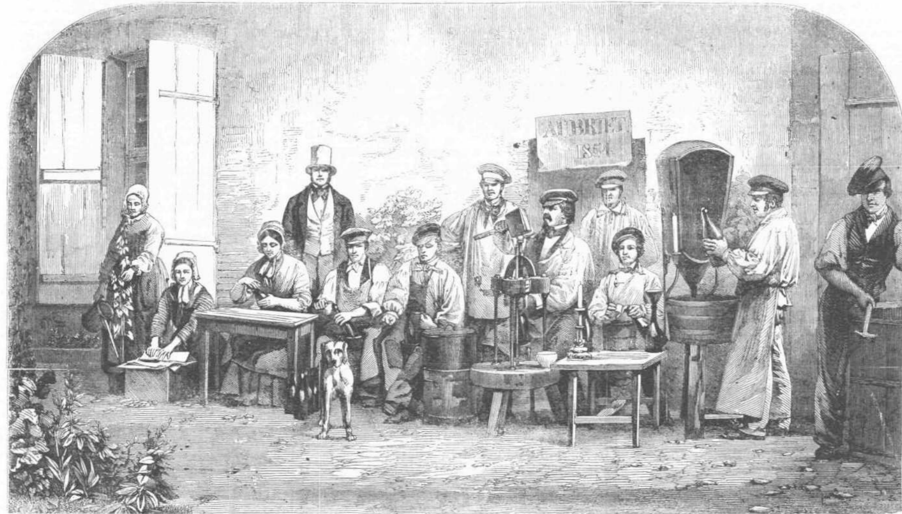
ΠΕΡΙΧΑΡΤΩΜΑ. ΠΕΡΙΦΥΛΑΒΜΑ. ΣΥΡΜΑΤΩΜΑ. ΕΠΙΔΡΑΣΙΣ. ΠΟΜΑΤΙΣΜΟΣ. ΕΚΠΟΛΥΤΙΣΜΟΣ. ΚΑΤΑΛΥΤΗΣΙΣ.