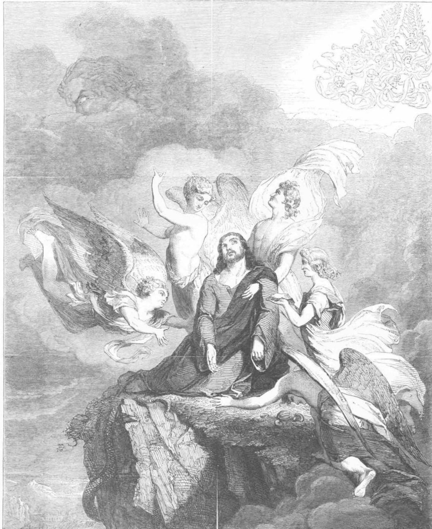
ΗΡ. ΤΙΝ.—Ο ΘΕΙΟΣ ΧΡΙΣΤΟΣ ΜΑΚΟΝΟΜΕΝΟΣ ΥΨ' ΑΓΓΕΛΩΝ ΜΕΤΑ ΤΗΝ ΦΥΤΗΝ ΤΟΥ ΗΙΕΡΑΣΜΟΥ.