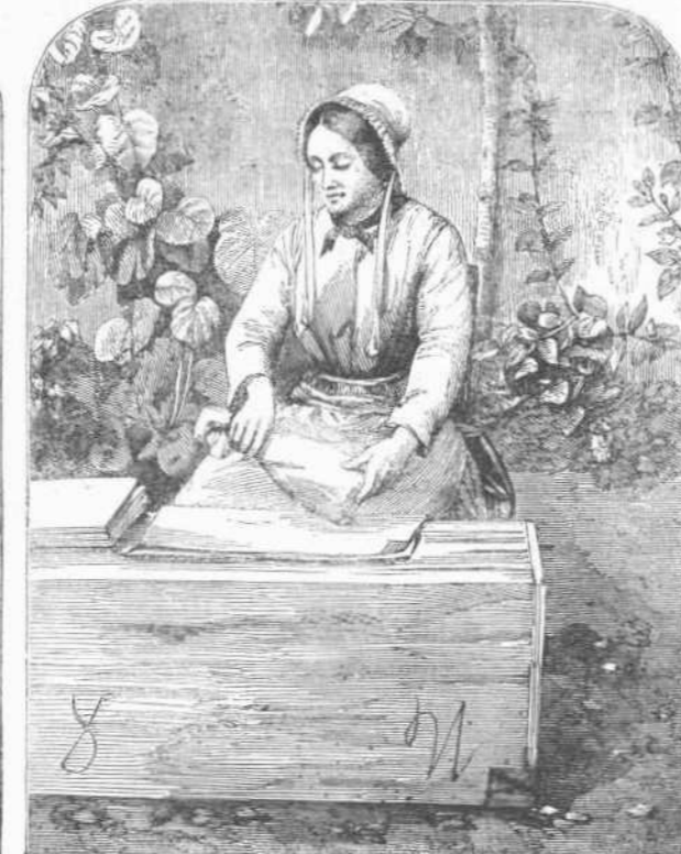
Η ΠΕΡΙΤΥΛΙΣΣΟΥΣΑ ΤΑ ΒΑΥΚΑΛΙΑ ΕΙΣ ΧΑΡΤΗΣ.

Ο ΕΝ ΒΕΡΤΗ ΤΗΣ ΓΑΛΛΙΑΣ ΒΑΥΚΑΛΟΥΜΕΝΟΣ ΚΑΜΗΑΝΙΤΗΣ (19 η σελ. 340.)