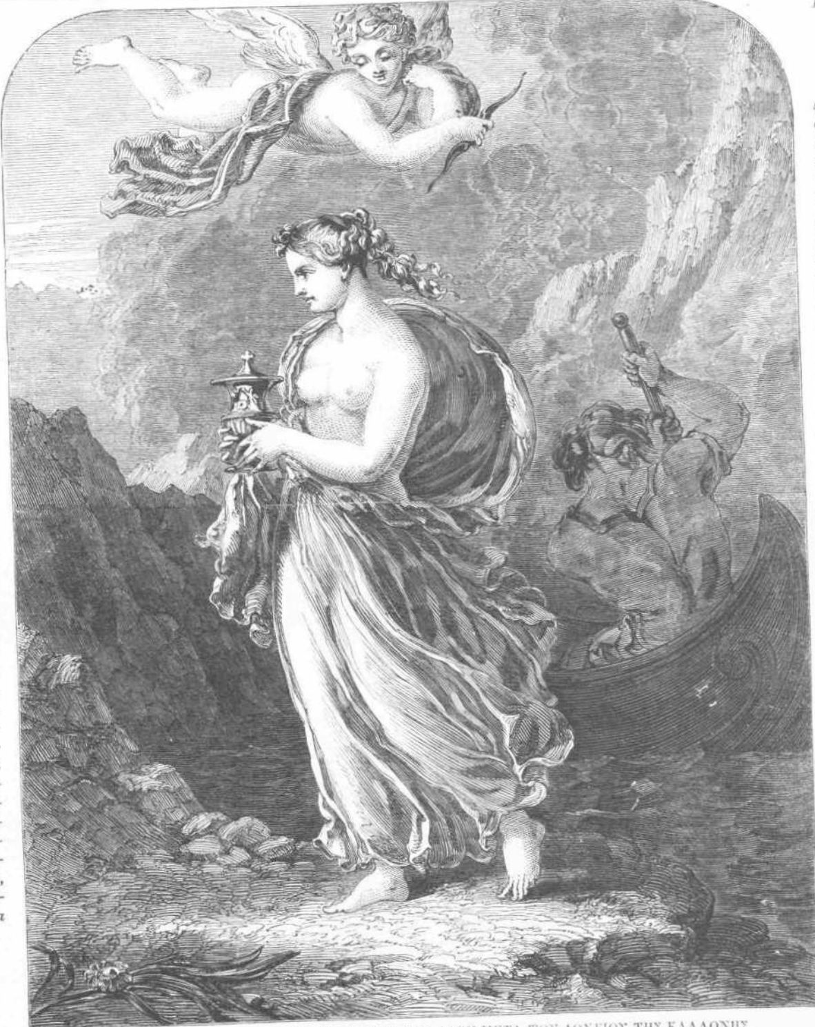
ΗΡ. ΤΕΧ.—Η ΤΥΧΗ ΠΑΝΕΡΧΟΜΕΝΗ ΑΠΟ ΤΟΥ ΛΙΟΥ ΜΕΤΑ ΤΟΥ ΔΟΧΕΙΟΥ ΤΗΣ ΚΑΛΑΘΗΣ.