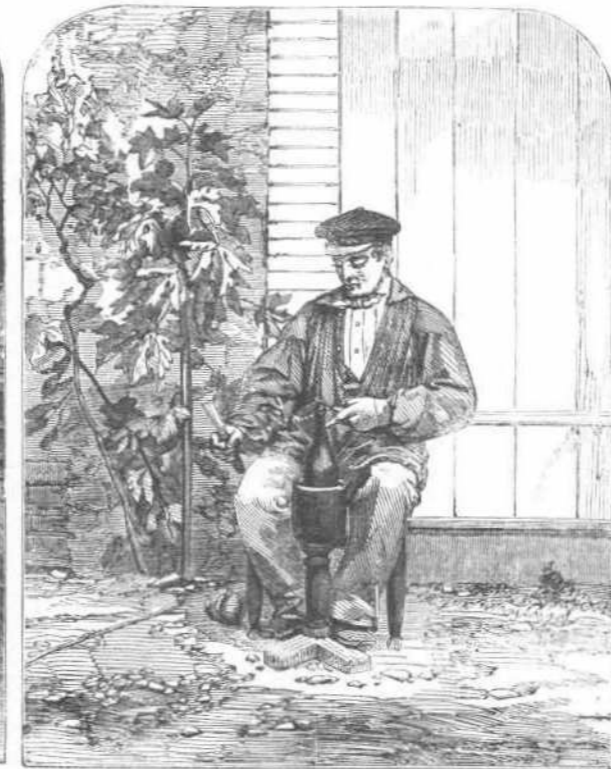
Ο ΔΕΝΣ ΤΟΝ ΦΕΛΛΟΝ ΔΙΑ ΧΟΡΩΣ.