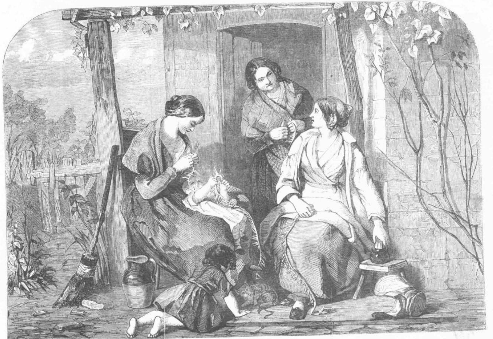
ΗΡ. ΤΕΧ.—ΕΥΤΥΧΕΙΣ ΚΑΙΡΟΙ.