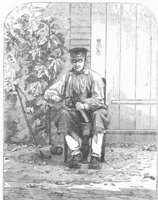
Ο ΑΣΦΑΛΙΖΩΝ ΤΟΝ ΦΕΛΛΟΝ ΔΙΑ ΣΥΡΜΑΤΟΣ.