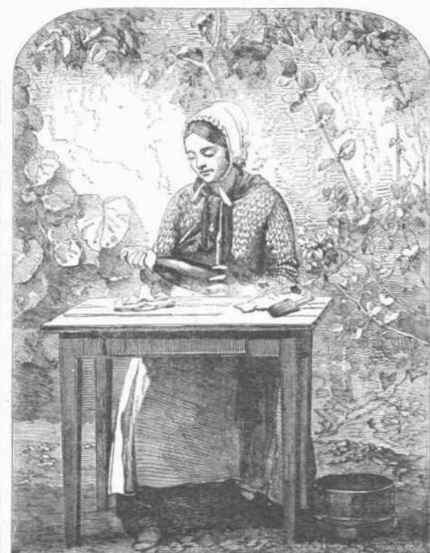
Η ΠΕΡΙΚΛΕΟΥΣΑ ΤΑ ΣΤΟ ΔΑΤΑ ΔΙΑ ΦΥΛΑΧΟΥ ΕΚ ΚΑΞΙΤΕΡΟΥ.