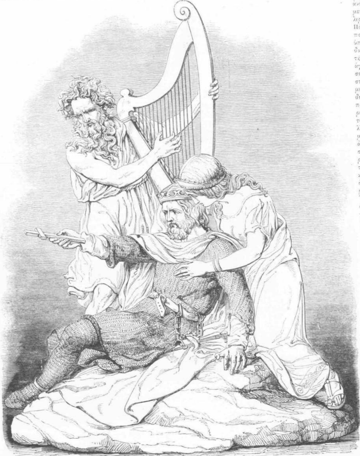
ΩΡ. ΤΕΧ.—Ο ΘΑΝΑΤΟΣ ΤΟΥ ΤΕΟΥΔΗΚΟΥ ΒΑΣΙΛΕΥΣ ΤΗΣ ΓΟΥΕΝΤΗΣ.