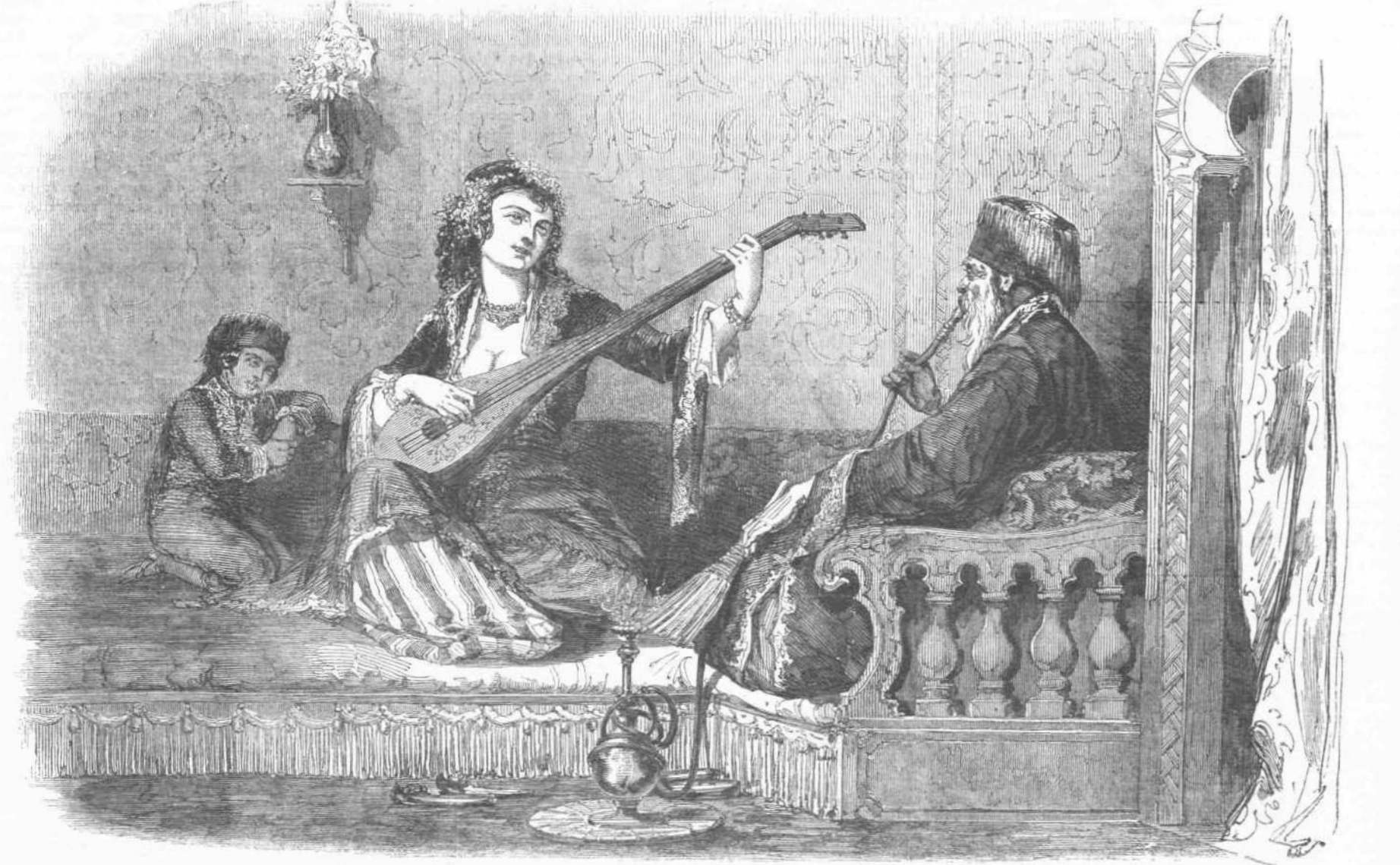
Ο ΠΑΣΑΣ ΚΑΙ Η ΔΟΥΔΗ.