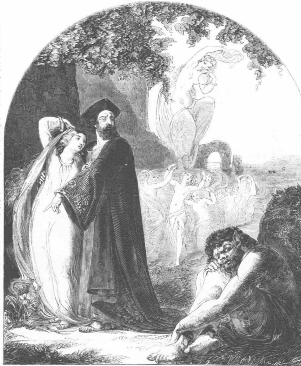
ΩΡ. ΤΕΧ.—ΣΚΗΝΗ ΕΚ ΤΟΥ ΔΡΑΜΑΤΟΣ ΤΟΥ ΣΑΚΣΠΙΡΟΥ «Ἡ ΤΡΙΚΥΜΙΑ».

Τὸ περὶ οὗ ὁ λόγος σχεδιάσμα, ἐκτεθῆν εἰς τῆς βασιλικῆς ἀκαδημίας τὴν ἐκθεσὶν τῶν ὀραίων τεχνουργημάτων,