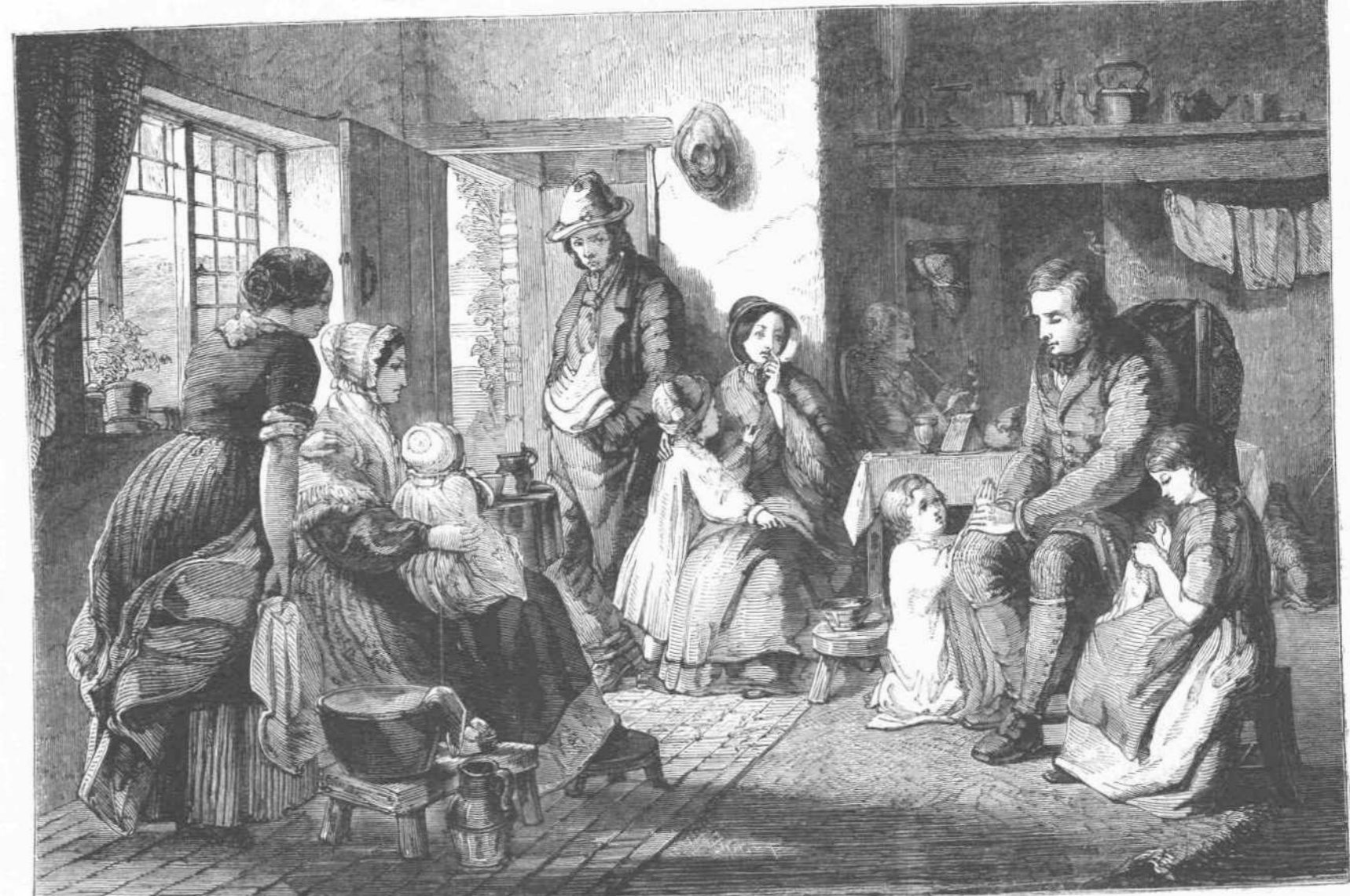
ΩΡ. ΤΕΧ.—Ἡ ΑΝΑΝΗΦΟΥΣΑ ΣΥΝΕΙΔΗΣΙΣ ΥΠΟ ΤΟΥ ΖΩΓ ΠΑΦΟΥ ΒΡΟΥΚ.