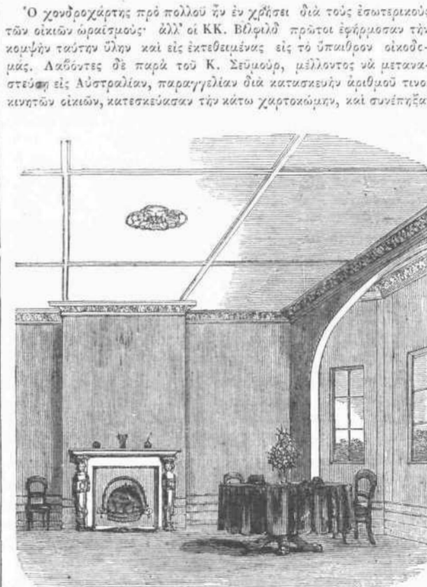
ΘΑΛΑΜΟΣ ΟΙΚΙΑΣ ΕΚ ΧΟΝΔΡΟΧΑΡΤΟΥ.