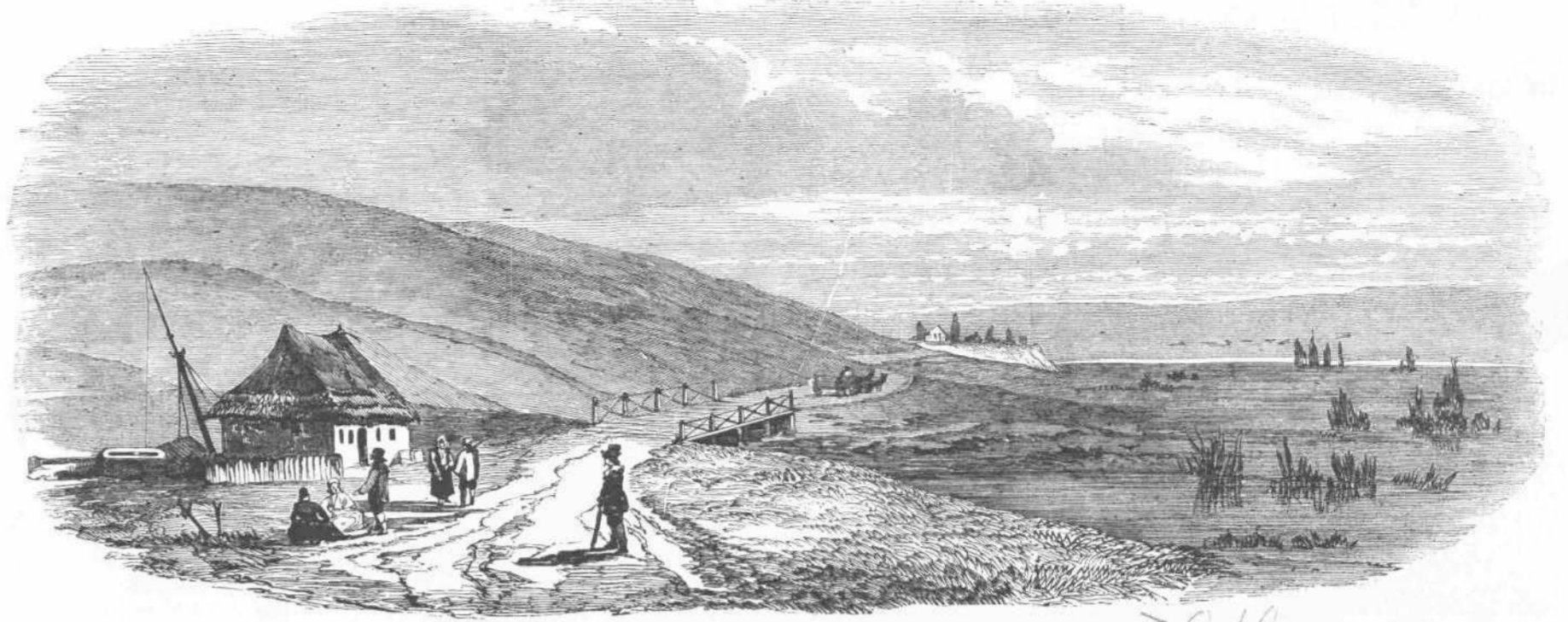
ΑΙ ΟΧΘΑΙ ΤΟΥ ΠΟΤΑΜΟΥ ΠΡΟΥΘΟΥ.