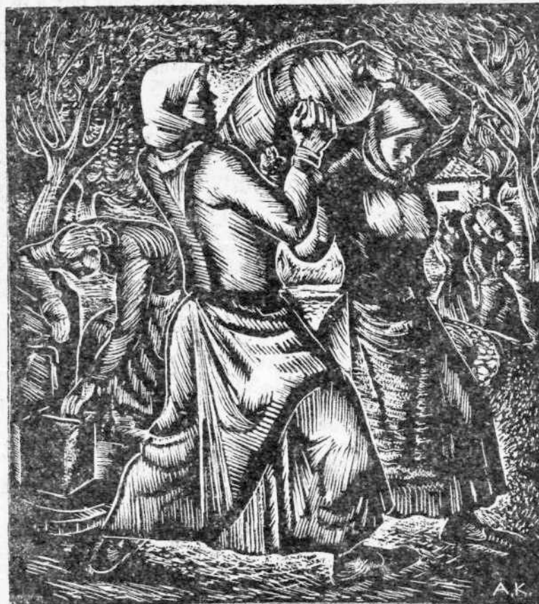
ΑΛΕΞ. ΚΟΡΟΓΙΑΝΝΑΚΗΣ: Στη βρύση.