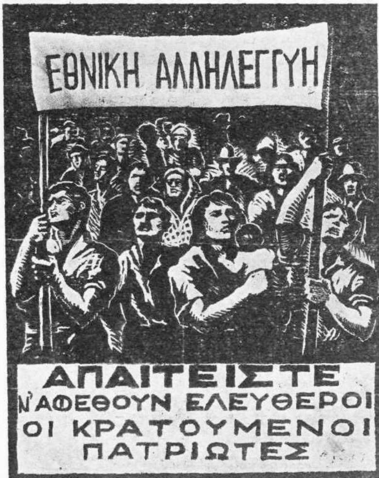
Άφισα στον καιρό της Κατοχής...