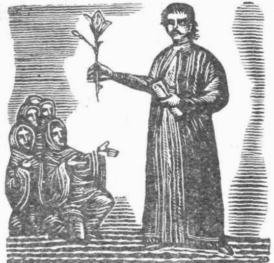
ΣΠ. ΒΑΣΙΛΕΙΟΥ: «Ρήγας Φεραίος» (άπό μυστική έκδοση τής Κατοχής)