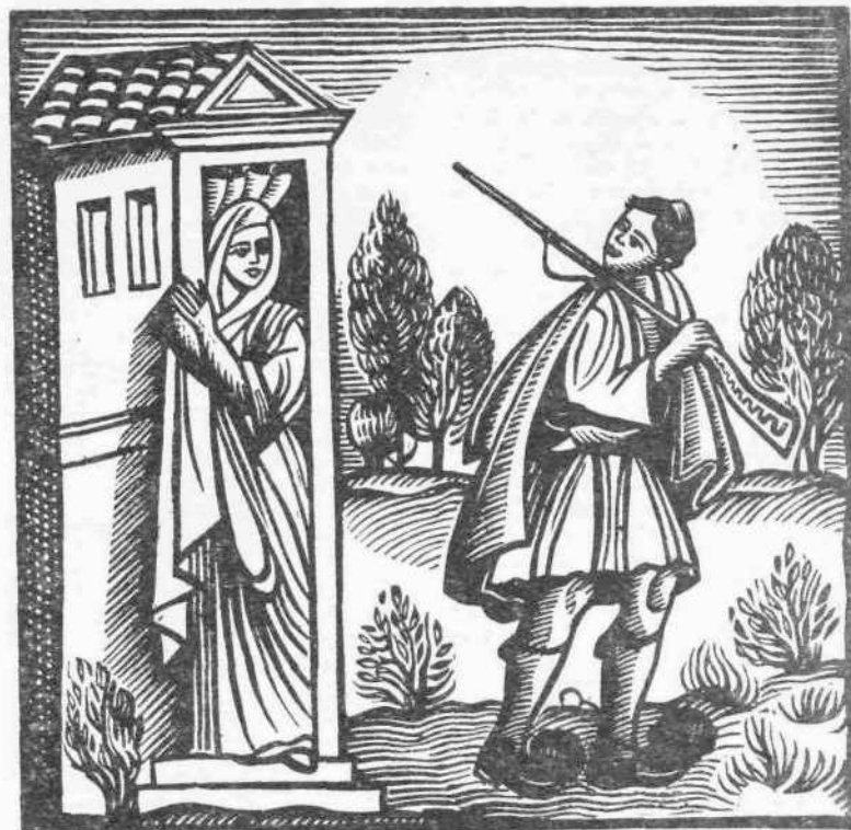
Βασιλή, κάτσε φρόνιμα νὰ γίνεις νοικοκύρης

(Σχέδιο Α. ΑΣΤΕΡΙΑΔΗ, Ξυλογραφία Α. ΤΑΣΣΟΥ Κυκλοφόρησε μυστικῶς τὸν καιρὸ τῆς σκλαβιάς).