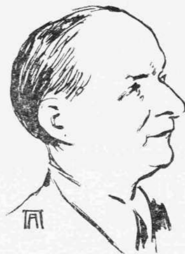
'Ο 'Οκτάβ ΜΕΡΑΙΕ