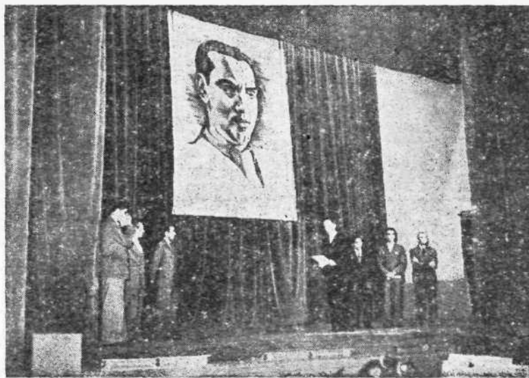
Ὁ ὄρκος τῶν ποιητῶν στὸν ΦΡΕΝΤΕΡΙΚΟ ΓΑΡΦΙΑ ΛΟΡΚΑ, θέατρο Σαιν-Μαρτέν, Παρίσι 19 Ἰουλίου 1937. Ἀπ' τ' ἀριστερὰ πρὸς τὰ δεξιὰ: Ρομπέρ Ντενός, Τριστάν Τζαρά, Λάγκστον Χιούζκς, Ἀραγκὼν (κέντρο), Νικόλας Γκιλλέν, Στρ. Τσίρκας, Κάρλος Πελισέρ. (Βλέπε σχετικὸ ἄρθρο στὴ σελίδα 5).