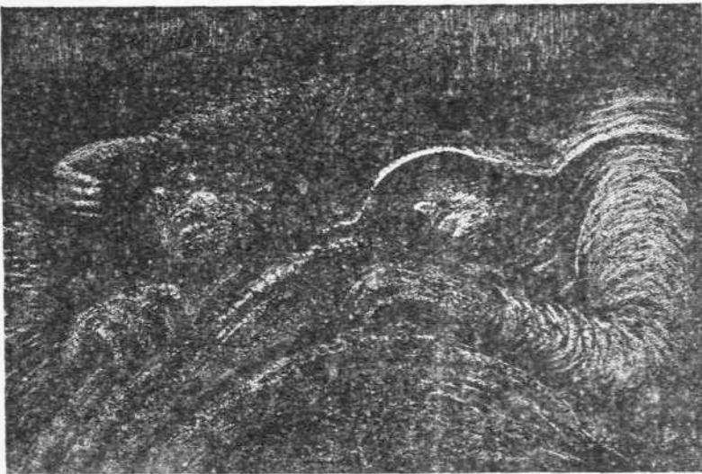
HENRY MOORE: «Υπνος στο καταφύγιο».