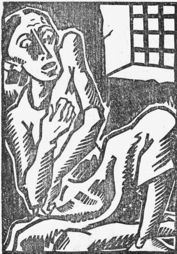
ΑΓΓ. ΘΕΟΔΩΡΟΠΟΥΛΟΥ: Τό κελί

'Ο ήθικος μηδενισμός της αντίδρασης δεν είναι φαινόμενο μόνο ελληνικό' στη διάρκεια της φασιστικής κατοχής σ' όλες τις ευρωπαϊκές χώρες παρατηρήθηκε το ίδιο φαινόμενο' ο παλιός κόσμος, που παρουσιαζόταν σαν θεματοφύλακας και φορέας όλων των εθνικών αξιών, απόδειξε την ψυχική του γυμνότητα και την ήθικη του αποσύνθεση' άνοιξε τις πόρτες στον κατακτητή, συνεργάστηκε μαζί του, χτύπησε τα κινήματα της λαϊκής αντίστασης και άτιμασε κάθε αξία. Προσπάθησε συστηματικά να σπάσει το μαχητικό πνεύμα των λαών και να λύγισι κάθε ύψηλο φρόνημα μέσα τους. 'Επιχείρησε να μπολιάσει τον ήθικό μηδενισμό του σ' ολόκληρο το έθnikό σώμα και να επιβάλει την ψυχική του έρημια σαν μια ανώτερη ήθικη και πνευματική κατάσταση και σαν κανόνα ζωής. Μά οι λαϊκές μάζες έδειξαν τέτοια ήθικη ρώμη, ώστε βγήκαν ολότελα γερές (Συνέχεια στη σελίδα 2)