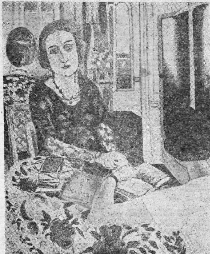
MATIS: Δύο γυναίκες.

Ύπάρχει μια άτμόσφαιρα Ματίς που δημιουργείται τόσο από τόν άνθρωπο όσο και από τό έργο, μια άτμόσφαιρα λεπτής και ήδονικής, γαλήνιας και σοβαρής πνευματικότητας, άπαλλαγμένης όμως από ματαιόδοξη άσθηρότητα.