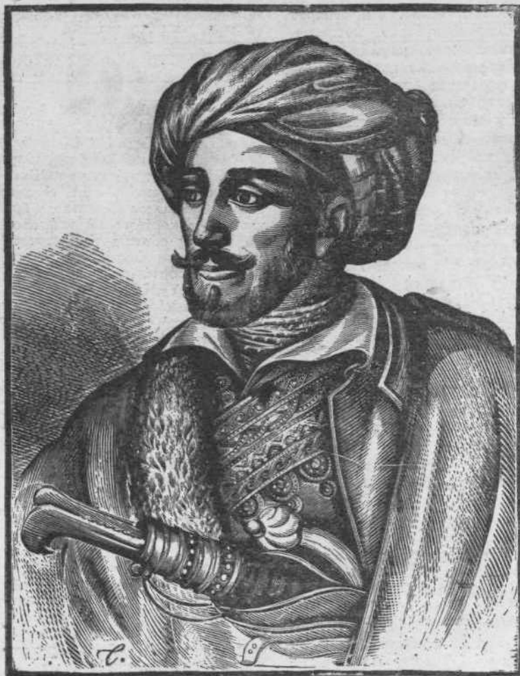
ΤΑΣΣΟΥ: Στρατηγός Μακρυγιάννης

Η δράση αυτή είναι πολυποικιλη. Αρχίζει από τη γνωριμία της λογοτεχνίας μας, με μεταφράσεις, σ' ένα πλατύτερο διεθνές κοινό, με τις μορφωτικές διαλέξεις τών καθηγητών του και τελειώνει με την εκμάθηση της