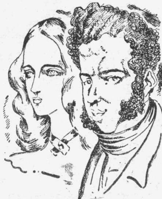
Ο Πούσκιν κι' η γυναίκα του