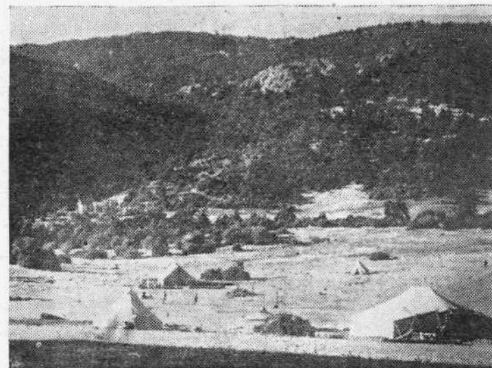
Η παιδική κατασκήνωση στην Πάρνηθα, καλοκαίρι του 1942, που οργανώθηκε από τον Ε. Ο. Σ. (τμήμα Άθηνών)

σας και σε μερικές δεκάδες φτωχών έκδρομικών, που ξεκινούσαν με τα πόδια, απ' την Άλυσιδα. Τις αδρές του θουού τότε, δεν τις μόλυβαν τα θρώμικα χυτά των φτωχόπαιδων του Γκαζιού, της Κοκκινιάς ή της Καισαριανής! *** Ο Έλληνικός Όρειβατικός Σύνδεσμος, ύπηρξε ένα πρωτόπορο σωματείο που πρώτο δημιούργησε μιά σοβαρή και οργανωμένη κίνηση προς το θουό. Η δράση του ήταν πολύπλευρη: