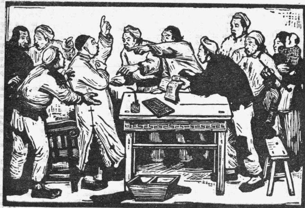
ΚΟΥ ΦΟΥΑΝ: Ο τακογλόφος