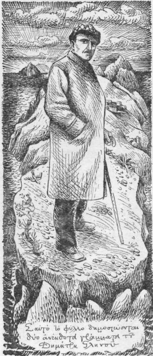
ΣΥΝΘΕΣΗ Α. ΑΣΤΕΡΙΑΔΗ