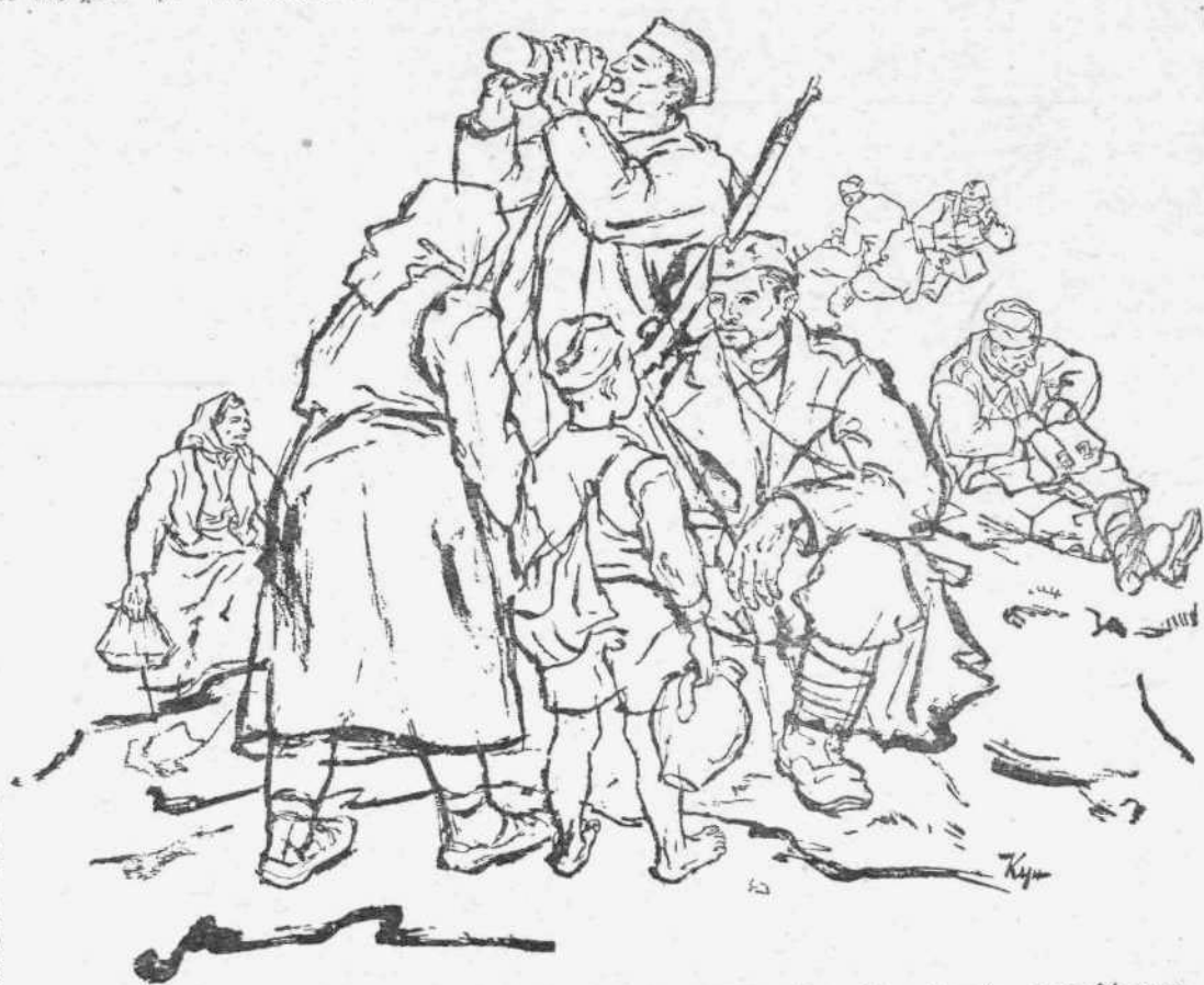
Σχέδιο του Γιουγκοσλαβού Δ. ΑΝΑΓΡΕΓΙΕΒΙΤΣ ΚΟΕΝ : «Φροντίδα για τούς παρτιζάνους»

Πρέπει να άντιληφθεί ή Κυβέρνηση ότι οι πνευματικές δημιουργίες τών Έλλήνων διανοούμενων δεν μπορεί να βρίσκονται στη διάκριση τών αστυνομικών διαταγών.