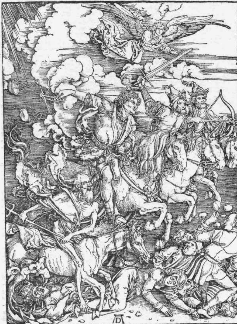
Ντόρερ : Οἱ τέσσερις καβαλλήρηδες τῆς ἀποκαλύψεως

Μαθαίνουμε πὼς μεταξὺ τῶν ἄλλων πού διορίστηκαν κριταὶ στὴν ἐπιτροπὴ γιὰ τὸ ποιητικὸ ἔπαθλο «Κωστή Παλαμά» εἶναι καὶ οἱ Ἄλκης Θρυλὸς καὶ Ἀνδρέας Καραντώνης. Κατόπιν αὐτοῦ προτείνουμε νὰ διοριστεῖ καὶ ὁ στρατηγὸς Ναπ. Ζέρβας. Ὅπως ἀπόδειξε στὴ «Βραδυνὴ» ὁ Καραγάτσης, καταλαβαίνει κι' αὐτὸς ἀπὸ ποίηση ὅσο τουλάχιστον κ' οἱ ἄλλοι δύο.