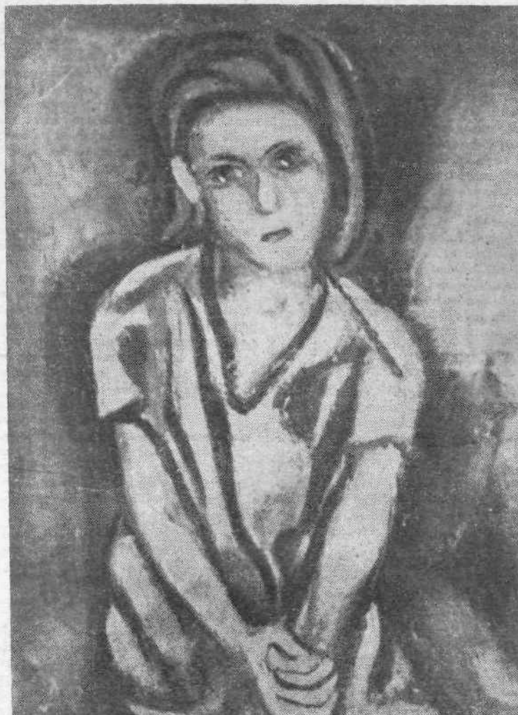
Ο. ΚΑΝΕΛΛΗ: Κορίτσι του λαού (λάδι)

Το περιοδικό μας παρακολουθεί με ένδιαφέρον τις καλλιτεχνικές άπαγγελίες του νέου θιάσου που τόσα στελέχη του είνε γνωστά στο άθηναϊκό κοινό για την άφοσίωση τους στην άληθινή, την προοδευτική τέχνη.