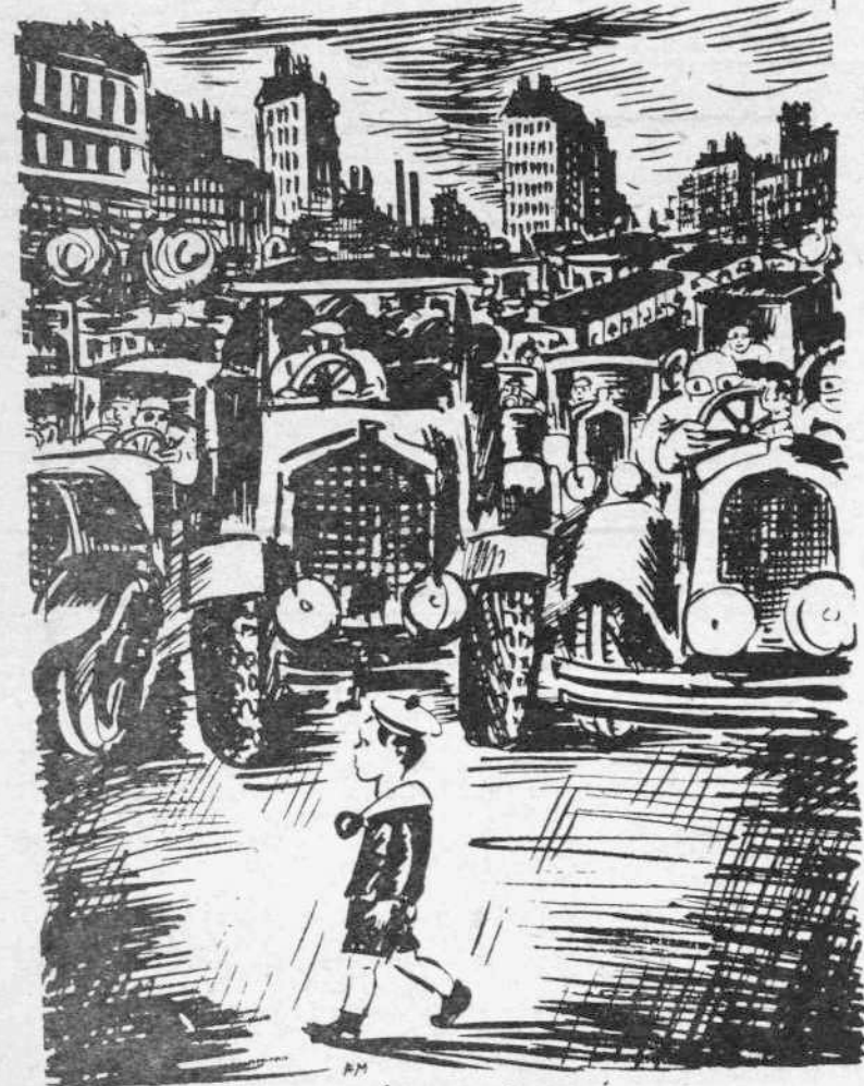
L'ouffant est chose précieuse et sacrée... Μ α ζ ε ρ έ λ : Στην άσπρη κοινωνία το παιδί είναι πολύτιμο, ιερό. (σχεδίο)

Γνωρίζει ο κύριος τροχός, διαβαίνει ο χρόνος, έρχεται κ' η άνοιξη, έρχεται το καλοκαίρι, οι γερανοί αλωνίζουμε τον ουρανό κι' απ' τα στενώματα κι' απ' τις κλεισούρες μες στα φαράγγια τα βαθειά κυλάνε