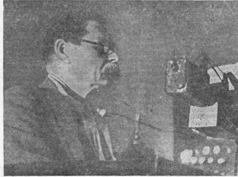
Ὁ Γκόρκυ στὸ πρῶτο Συνέδριο τῶν Σοβιετικῶν συγγραφέων (17 Αὐγούστου 1934).

Πορτογάλικες προετοιμασίες γίνονται στοὺς πνευματικὸς καὶ ἐπιστημονικὸς κύκλους γιὰ τὸ γιορτασμὸ τῶν 150 χρόνων τῆς Ἀκαδημίας τῆς Μόσχας.