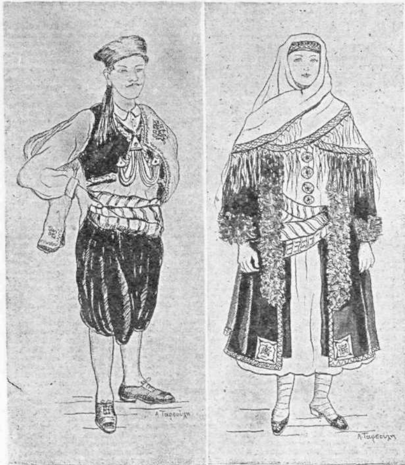
ΑΘΗΝΑΣΣΤΑΡΣΟΥΛΗ: Κοστος μια Δωδεκανησου (Ἀριστερὰ Κάρπαθος, δεξιὰ Καστελόριζο).

— Κι' ὅταν οἱ δράκοι θὰ φύγουν ἀπ' τὸν τόπο μας καὶ δὲ θάμαστε πιά σκλάβοι, τότες πὺ δυὸ ἡλιοι θὰ φωτίσουν τὴν Ἑλλάδα μας, δὲ θὰ πρέπει νὰ ξεχάσουμε τὰ παλληκάρια με τὰ φωτεινὰ μαλλια πὺ σκότωναν τοὺς δράκους καὶ θὰ τοὺς πηγαίνουμε λουλουδια στὸ κοιμητήρι. Τὸν τάφο σου, Γιάννη, δὲν τὸν ξέρουμε, στὴν καρδιά ὄμως τοῦ μικροῦ σου φίλου θὰ φροντισουμε ἡ μνήμη σου νὰ μείνει ἀκέρια.