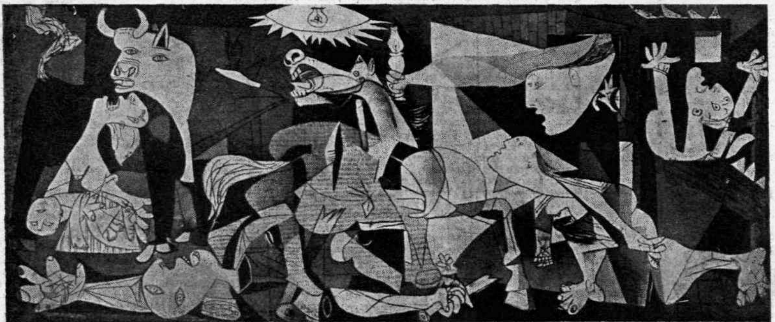
ΠΙΚΑΣΣΟ : Γκουερνίκα.