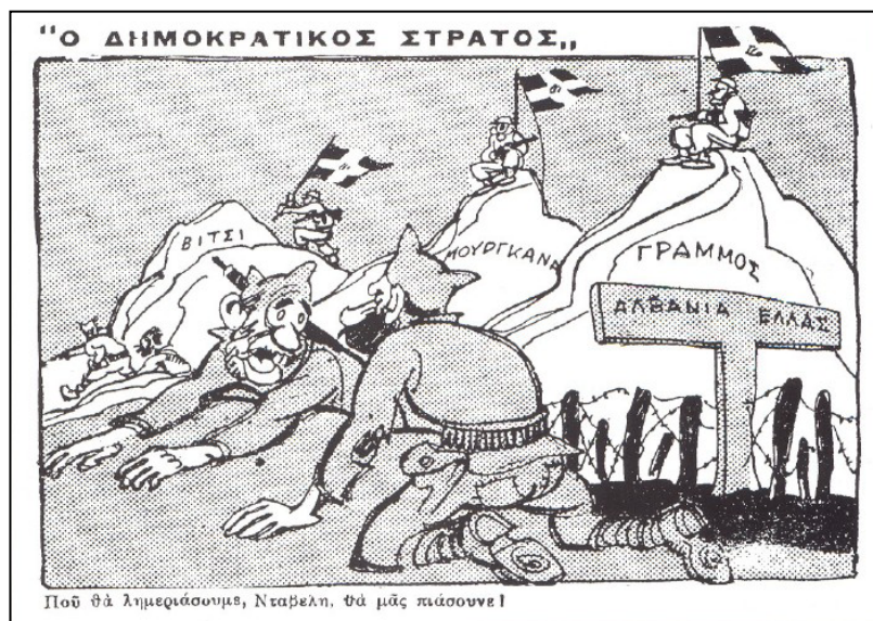
Εικόνα 5. Γελοιογραφία του 1949 (Εφημερίδα «Εθνικός Κήρυξ»)