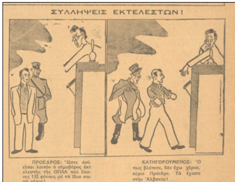
Εικόνα 4. Γελοιογραφία του 1948 (Χιουμοριστική Εφημερίδα «Λαχανίδα»)