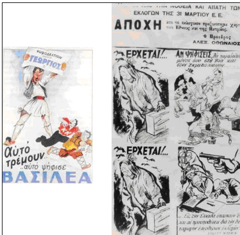
Εικόνα 3. Αφίσες για το Δημοψήφισμα του 1946