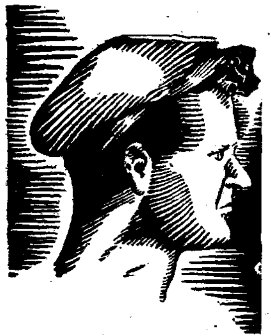
Ο Ναζιμ Χικμέτ