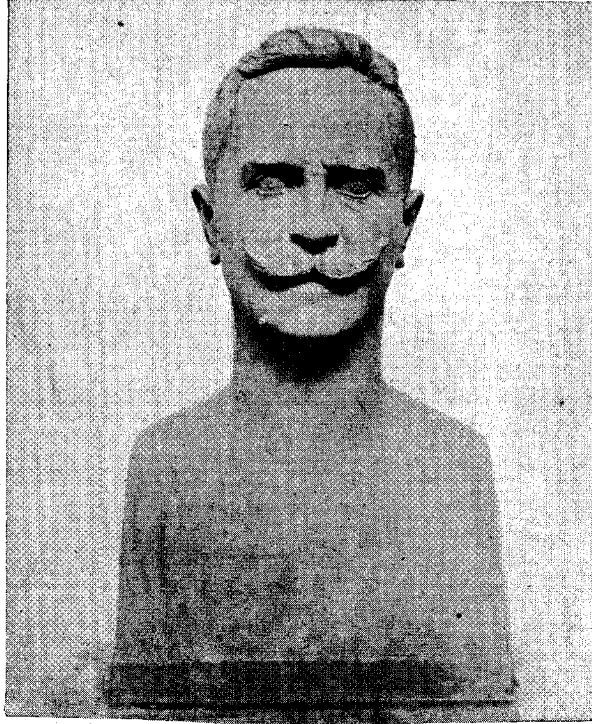
ΜΙΧ. ΤΟΜΠΡΟΥ: Προτομή Βλάση Γαβριηλίου.