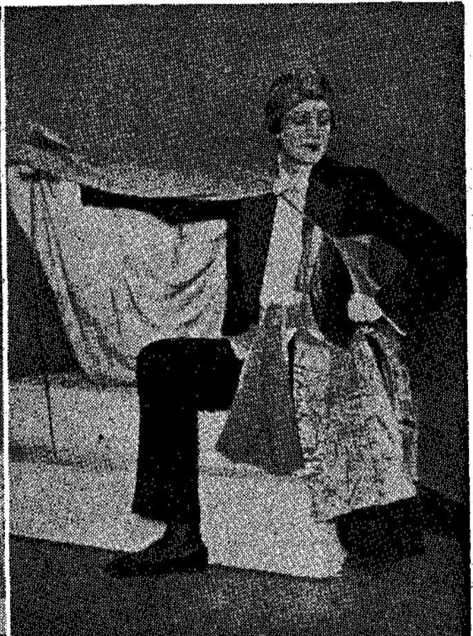
«ΤΟΥΡΑΝΤΩ», ΟΠΩΣ ΤΟ ΕΣΚΗΝΟΘΗΣΕ Ο ΒΑΚΤΑΓΚΩ. 'Αριστερά : Το σκηνικό θέσμιο του έργου. Δεξιά : κοστούμι του πρωταγωνιστή Καλάφ στο ίδιο έργο. Το «ΤΟΥΡΑΝΤΩ» θα παιχθεί στο Βασιλικό Θέατρο την έρχόμενη εβδομάδα.