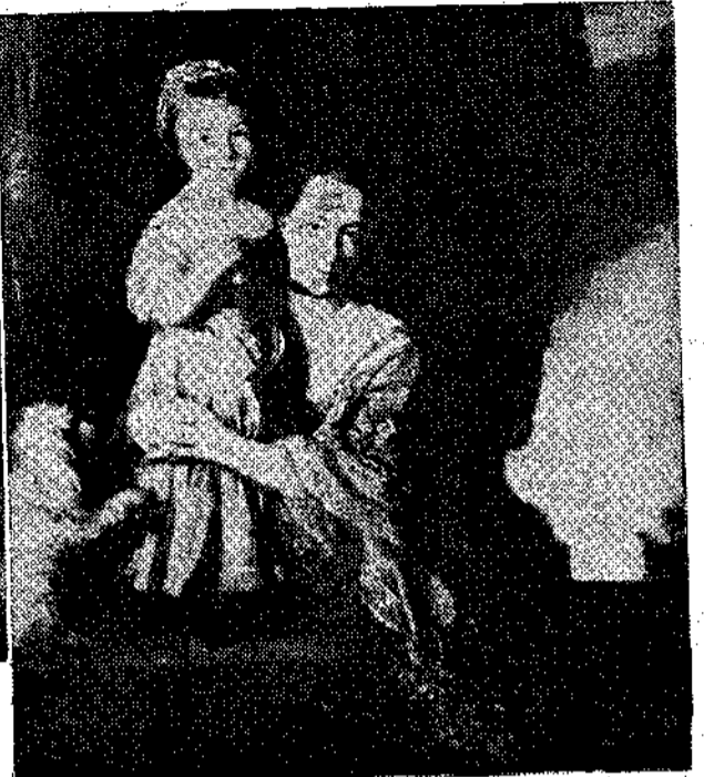
ΑΠΟ ΤΗΝ ΑΠΑΔΡΟΜΙΚΗ ΕΚΘΕΣΗ ΣΤΟ ΛΟΝΔΙΝΟ ΤΟΥ ΠΕΡΙΟΔΟΥ ΑΓΓΛΟΥ ΠΡΟΣΩΠΟΓΡΑΦΟΥ ΡΕ.Υ.ΝΟΑΝΤΣ. 'Από τ' άριστερό προς τὰ δεξιά : «Ιωάννης, Λόρδος Μπέργκερ» [1787], «Η οικογένεια Ρόβιν» [1786], «Η Τζιορτζάνα, κόμισσα Σπένσερ κ' η κόρη της» [1761]