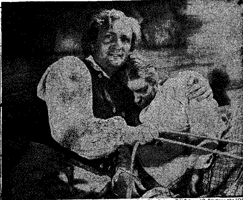
ΑΠΟ ΤΟ ΦΙΛΜ «ΠΕΡ ΓΚΥΝΤ» ΤΟΥ ΙΥΕΝ, ΠΟΥ ΘΑ ΠΑΙΧΤΕΙ ΤΗ ΔΕΥΤΕΡΑ ΣΤΟ «ΡΕΣ». ΠΡΩΤΑΓΩΝΙΣΤΗΣ Ο ΧΑΛΣ ΛΑΜΠΕΡΣ. 'Από τ' άριστερό προς τὰ δεξιά : Πέρ Γκύντ—Σόλβεγκ.—Ο θάνατος της "Όζε