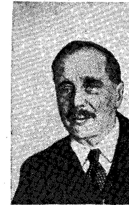
ΕΝΑΣ ΕΝΑΣ ΚΥΝΙΚΟΣ: Ασφαλώς όχι. Βρίσκεται σε πλήρη αντίθεση...