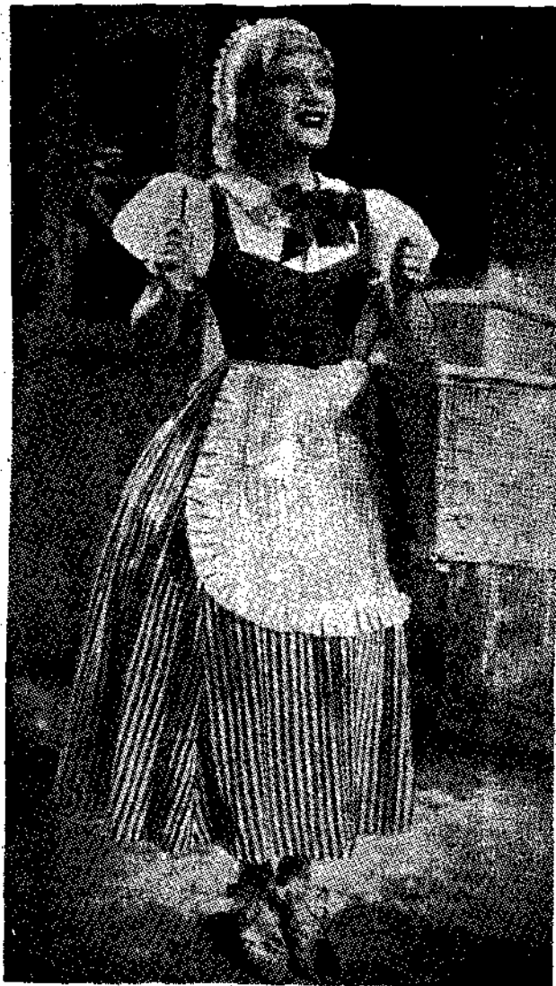
Η ΜΑΡΘΑ ΕΓΚΕΡΘ στη νέα αγγλική ταινία «Η μεγαλειότης επιτυχίας της».