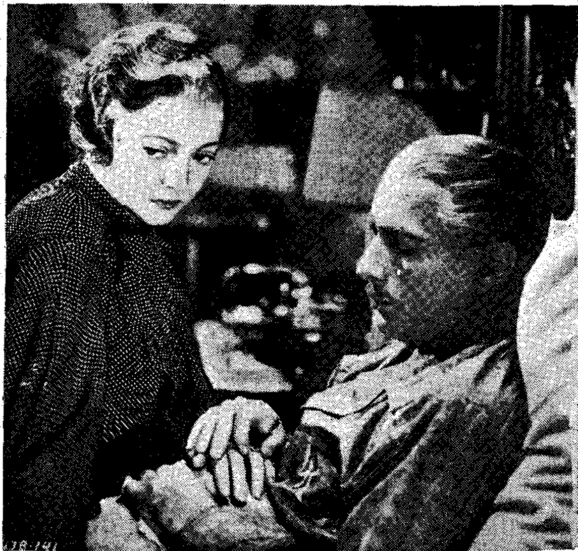
Η ΣΥΒΑΒΙΑ ΣΙΝΤΝΕ-Υ: στο έργο «Τζέν Τζέραλ» που παίζεται στο «Πλάσα» την έρχόμενη εβδομάδα.