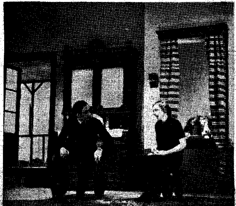
ΜΕΓΑΛΟ ΕΜΒΑΘΡΙΑΣ, θέατρο Μαρτίνας Κότοπούλη. Αριστερά μία σκηνή από την Β' πράξη, δεξιά από την Δ' πράξη.