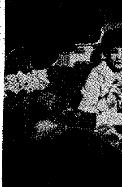
Η Κολέτ γράφοντας... Η Κολέτ γράφοντας... Η Κολέτ γράφοντας...