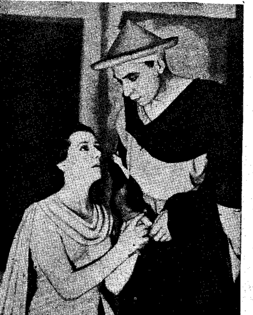
Η Ρενί Πτεβιλιάρ (στο ρόλο της Ηλέκτρας) και ο Λουί Ζουβέ (στο ρόλο ενός βασιλικού υπαξιωματικού...