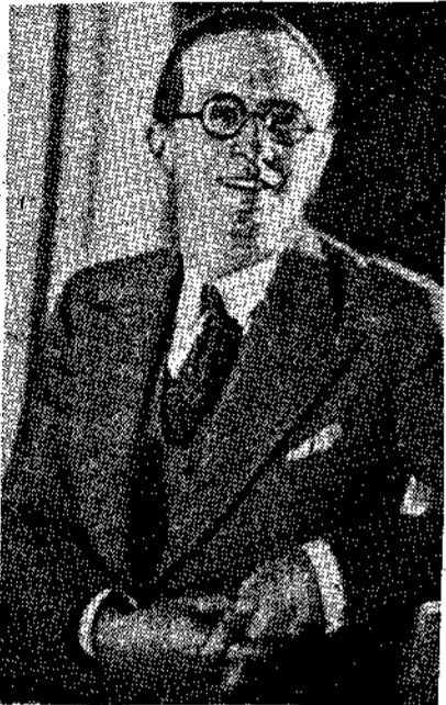
Ο Ζάν Ζουβέ