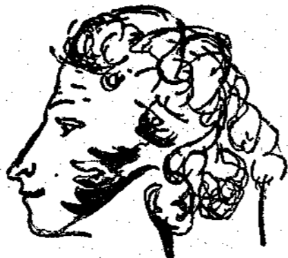
Σκίτσο του Πουβίνου από τον ίδιο