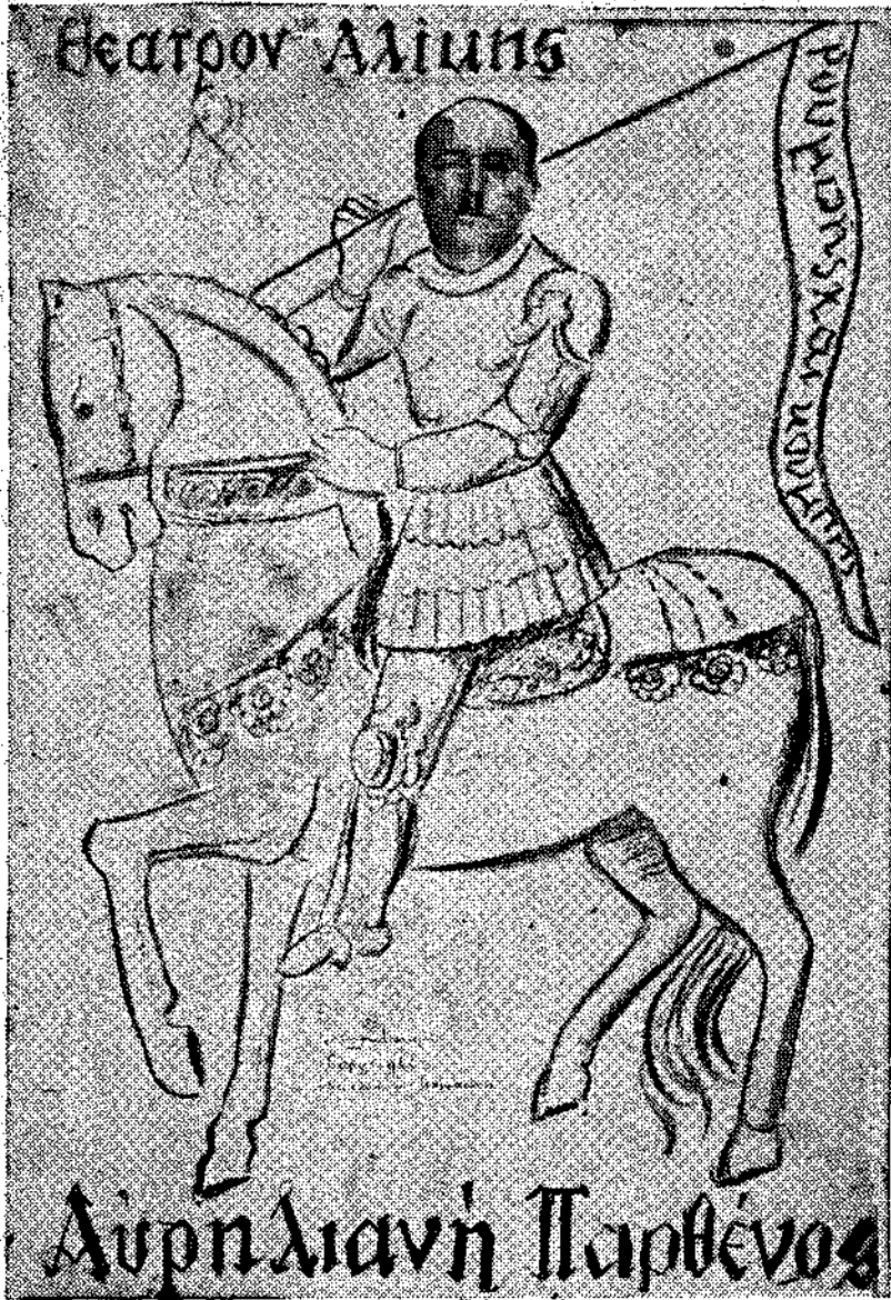
(Γελοιογραφία του κ. Νηφ. Μπεκρή)