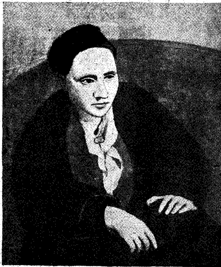
2) Πικασό: Πορτραίτο της Γετρούδης Στέιν