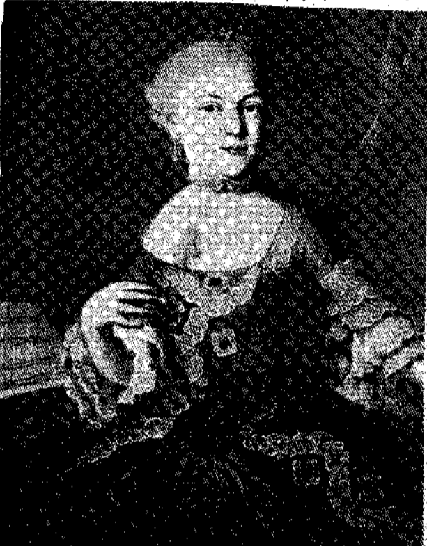
Η αδελφή του Μότσαρτ, Μαρία Άννα Μότσαρτ, στα 1762.

Χτές, 1η του Οκτωβρίου ημεομα πάλι στο κόμη Σάλερν. Και σήμερα, στις 2 του μήνα, έφαγα εκεί. Απέναντι τις 3 μέρες έπαιξα πολύ, όμως έπαιξα μ' ευχαρίστηση. Ο μπαμπάς όμως δεν πρέπει να φανταστεί πως είμαι για το χατίρι της... στο Σάλερν, όχι, αυτή δυστυχώς είναι στην ύπαιθρο και δεν είναι ποτέ σπίτι. Αβρίο όμως χωρίς, κατά τις 10, θα πάω μαζί με την κυρία Χέιν, πριν δεσποινίσα Τσοάν, να τη