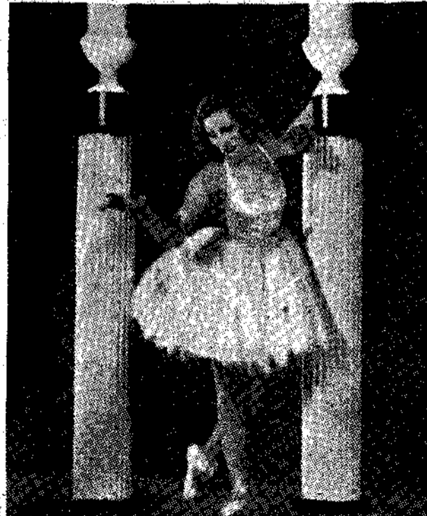
'Η Ζοάν Φονταίν