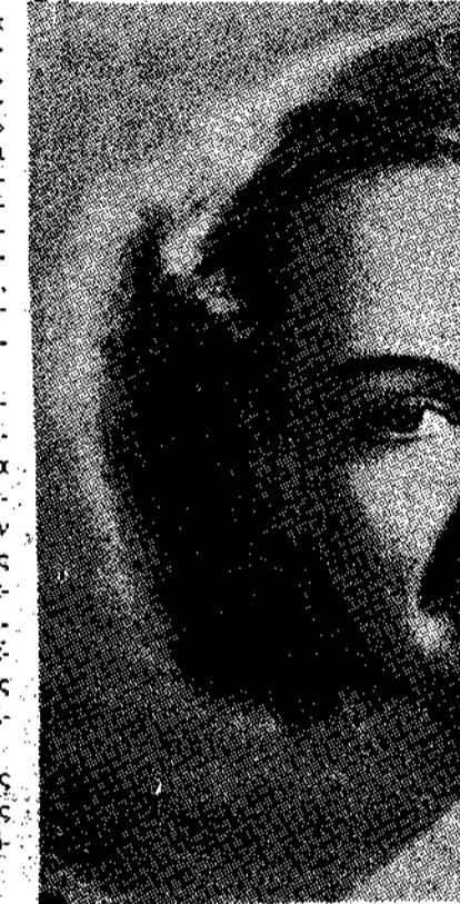
Μια νέα βεντέτα του Αμερικανικού κινηματογράφου: ή Μπέου Ράντ.

...Ομορφο θέατρο του Άττικού, Αιολύλου «Πέρες»