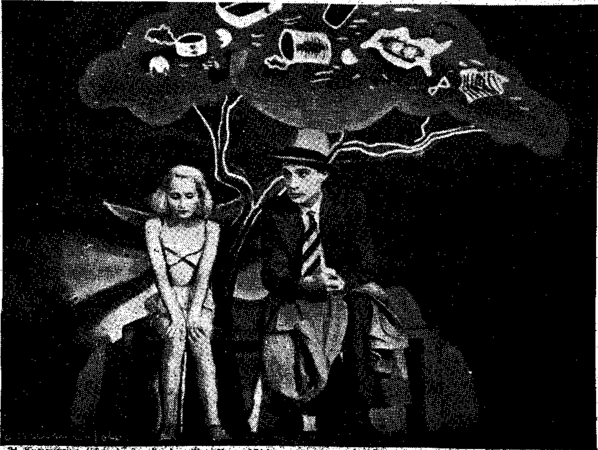
Η Κυριακή της εδέσσης της ελαμένης Πελωπίδας. (Βλέπε στη σελίδα 4 ἀναπόκριση από τὸ Παρίσι του έκλεκτου συνεργάτη μας κ. Θρόσου Κασσανίτη).

Κάθε φορά πού τέτοιες σκέψεις περνούν από το μυαλό μου, μου δύναι τη θεομάρσια άποκρίση πού έδωσε ο Κωνσταντίνος ΣΤ' σ' ένα καλὸ γηροῦ. Ο Κωνσταντίνος ΣΤ' — είναι αὐτός πού τὸν τύφλωσε η μητέρα του — στάθηκε μιά από τις πιο φωτεινές μορφές τῶν αναμορφωτῶν αυτοκρατόρων του Βυζαντίου. Σαν τέτοιος, συγκέντρωσε βέβαια, δλο τὸ μίος τῶν καλογίμων. Κάποτε ένας απ' αὐτὸς έφτασε ίσάμει την αἰθούσα του θρόνου, κι' εκεί, μπροστά σ' δλο