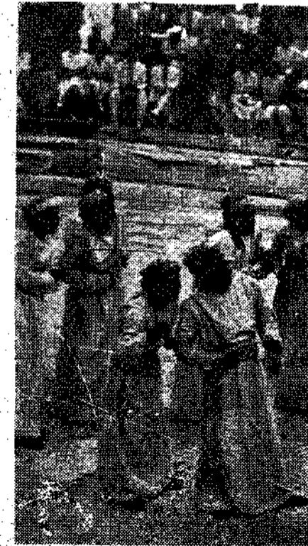
Όμορφο θέατρο του Άττικού, Αιολύλου «Πέρες» από την άποψη των Γάλλων φοιτητών. Η θαυμαστή σκηνή της επιλόησης και φωνητισμός του Δαρείου.

...κομμάτι δεν έχουν ακόμα. Μια σειρά από γερμανικές ύπερες θάθελαν να δώσουν, κ' επιδομούν αυτή τη σειρά να τη συνθέσω έγω. Ο άναρχος γελήθηκε καθηγητής Χούμπερ, είχε κ' αυτός από το κείνο, πού το επιδομούν. Γάρα πρέπει να πάω να κοιμηθώ. Δεν γίνεται άλλοωτικά, είναι ακριβώς 10 ή άρα!