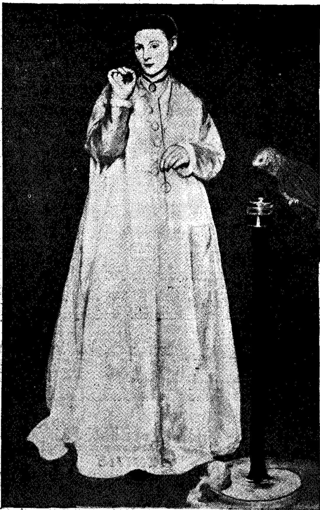
1) Μανέ: 'Η γυναίκα με τόν παταγώλο