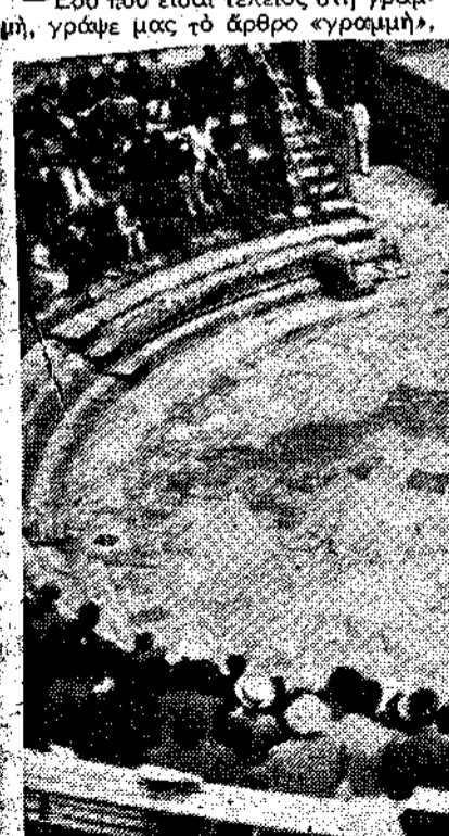
Όμορφο θέατρο του Άττικού, Αιολύλου «Πέρες» από την άποψη των Γάλλων φοιτητών. Η "Αποσσα κ' ο χορός.

...Ομορφο θέατρο του Άττικού, Αιολύλου «Πέρες»