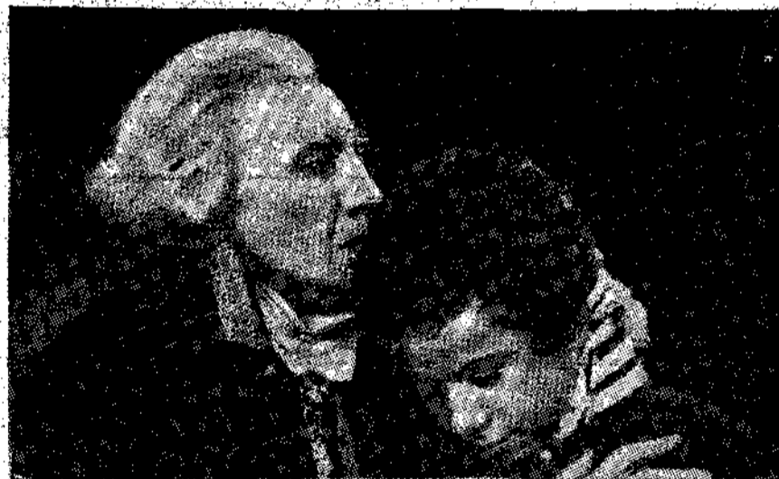
3) Μία σκηνή από τη νέα ταινία γέρο από τη ζωή του Ρούσκιν. 'Ο Αιτήρακι στο βόλο του Ρούσκιν-παιδιού.