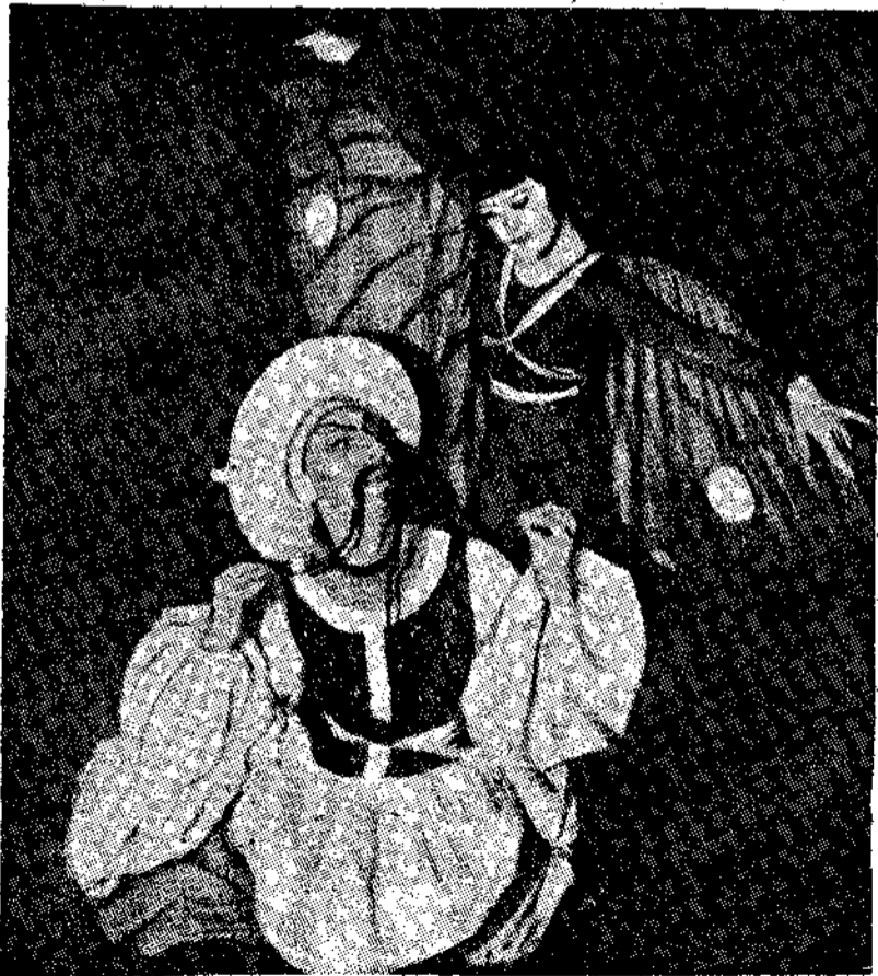
Ἡ Ραζβίνοβ κ' ἡ Κουονετσόβα εἰς μιὰ ἀλλεῖα «Ἐρωτικῆς Δοκιμασίας», στὸ Παρίσι.