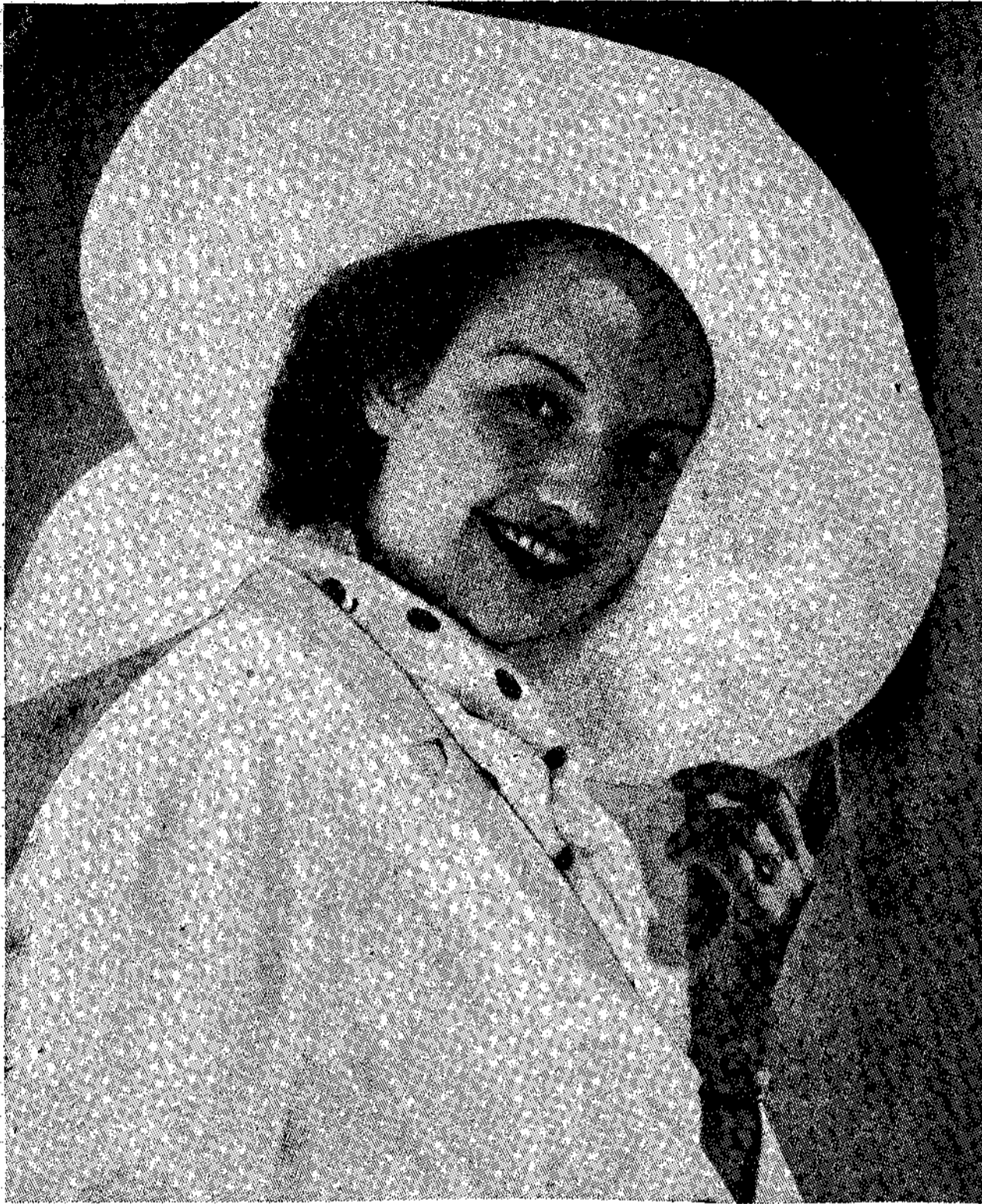
Ἡ Ραζα Κοθνίζον εἰς μιὰ νέα τριανιά.