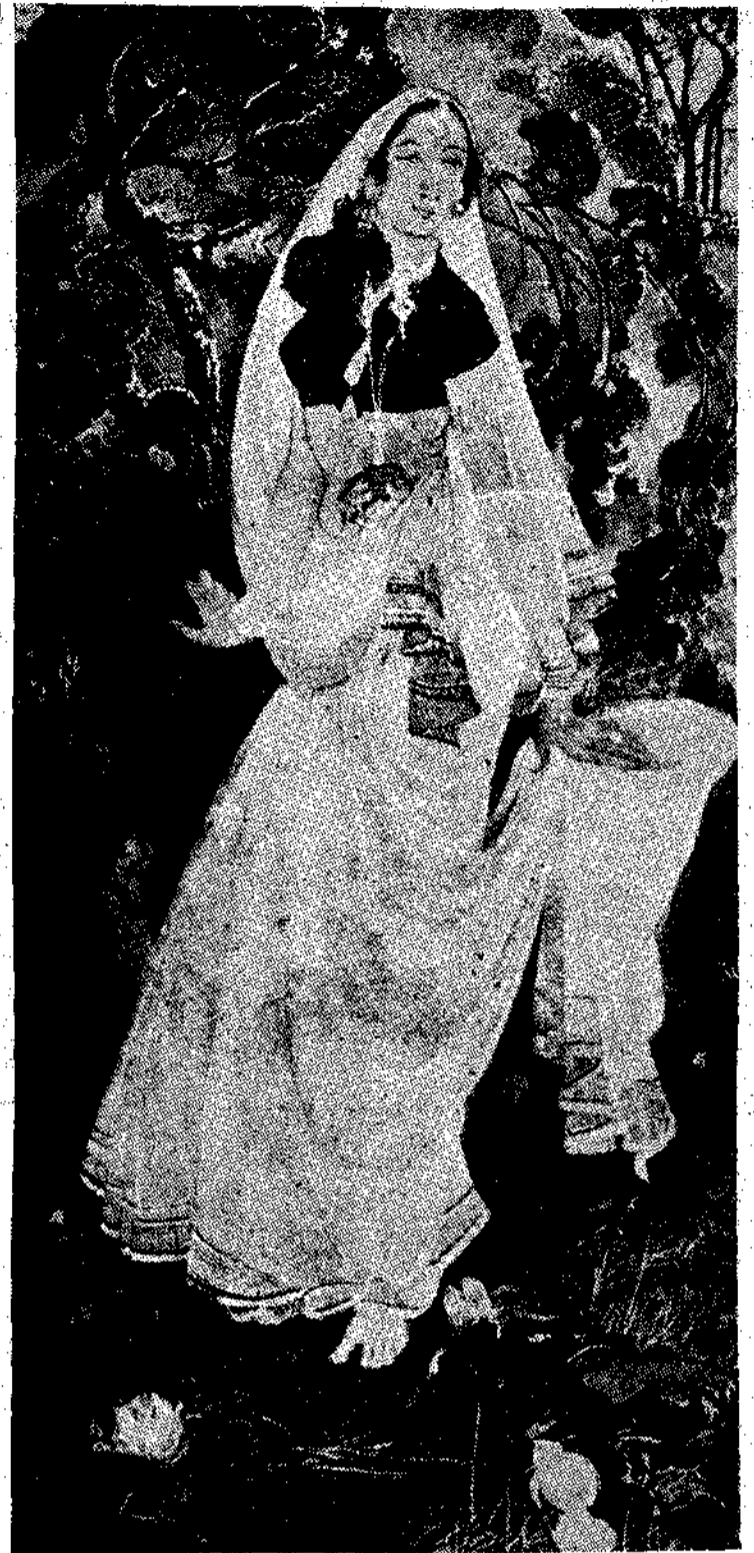
Ἀκουστέλα τοῦ Τσουνητάρι, ἐμπνευσμένη ἀπὸ τὰ ἔργα τοῦ Ρομπιτρονὰ Τσαγκόρ.