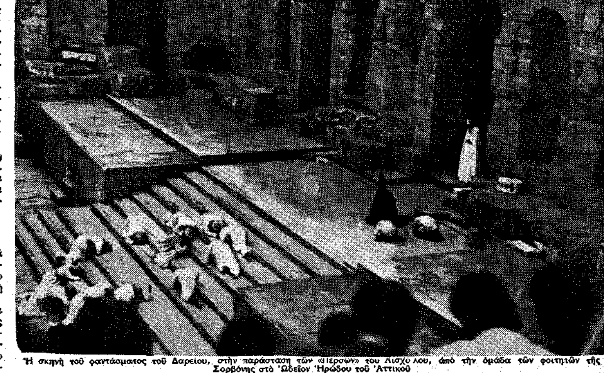
Η σκηνή του δραματικού του Δαρειού...

Είπα: «Θες ντροπή και πικρία, β...» Η απάντησή του ήταν απλή... «Τα δόξα σου...»