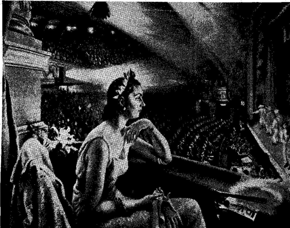
Μία θαυμασία νεότερη φωτογραφία του «Παλλάδιου» του Λονδίνου.

Συχνά λέμε για τον τοπο μας: «Είναι ο πρώτος σταθμός προς την Ευρώπη». Ξεχνούμε πως η αντίθετη διαπίστωση, όπως στέκεται ο τελευταίος σταθμός της Ευρώπης προς την Ανατολή, μπορεί να είναι — και σφαλώς είναι — η πιο άληθη. — Είναι ακόμα φανερό, πως στο βάθος είμαστε ένας λαός μισορατσιστικός. Για χρόνια που μείναμε υποσουλαι, μάς κληρονομήσαν τον πνευματικό ελαχιστισμό αντίστασης και της υποταγής. Το τουρκικό «κινέμετο» έχει την ίδια αξία, σαν κοσμοθεωρία, και για εμάς. Η φιλοσοφία του Ναστραντίν Χάτζα, είναι και δική μας φιλοσοφία. Η εβραϊκή μας δεν είναι τίποτ' άλλο, παρά μία πιο τμητή εκδοχή της θυμοσοφίας του. Έκείνο που ιδιαίτερα μάς χαρακτηρίζει είναι η επιφάνεια. Το βάθος, η ουσία της ζωής, δεν μάς απασχολεί σχεδόν ποτέ. Μας τρομάζει. Τον Ίβν Λιγγυνοϊόδουμε και για τις κορυφές. Κρατούμαστε πάντα, με θαυμαστή αληθινά ταχυδακτυλουργία, έπάνω στον άφρο. Μας λείπουν όλότελα τα φτερά και μαζί τους η νοσταλγία των αλβέρων. Έτσι, βέβαια, βρισκόμαστε εξασφαλισμένοι, πως δεν πρόκειται ποτέ να συντριβούμε. Όμως σύγχρονα μάς λείπει η ικανότητα του όψιμου.