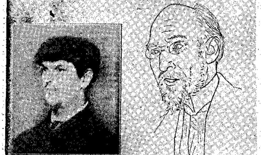
Επίσημο πορτρέτο του Σατι