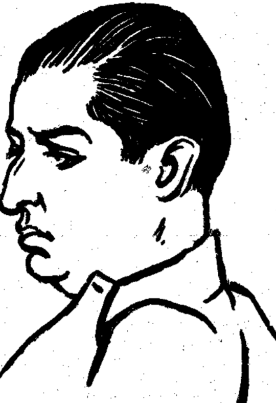
Το σκίτσο του Κ. Καραγάτση είναι κομμάτι από τη συλλογή του...