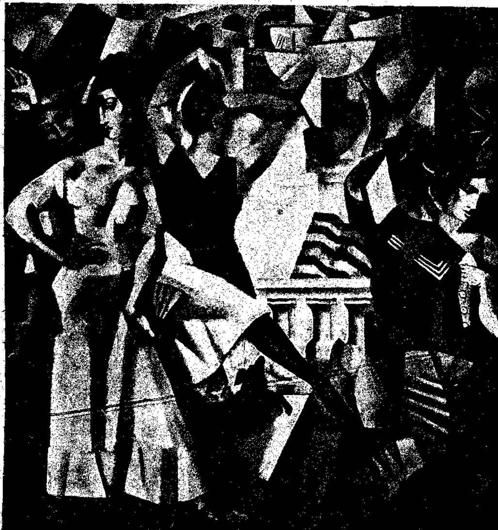
Α. ΔΟΥΡ: «Η σχολή»