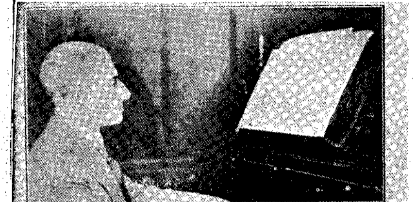
Επίσημο πορτρέτο του Ντεμπυσσύ

Με το να τονίσω μονάχα τον Ντεμπυσσύ, από τους τρεις τον πιο ένδοξο.