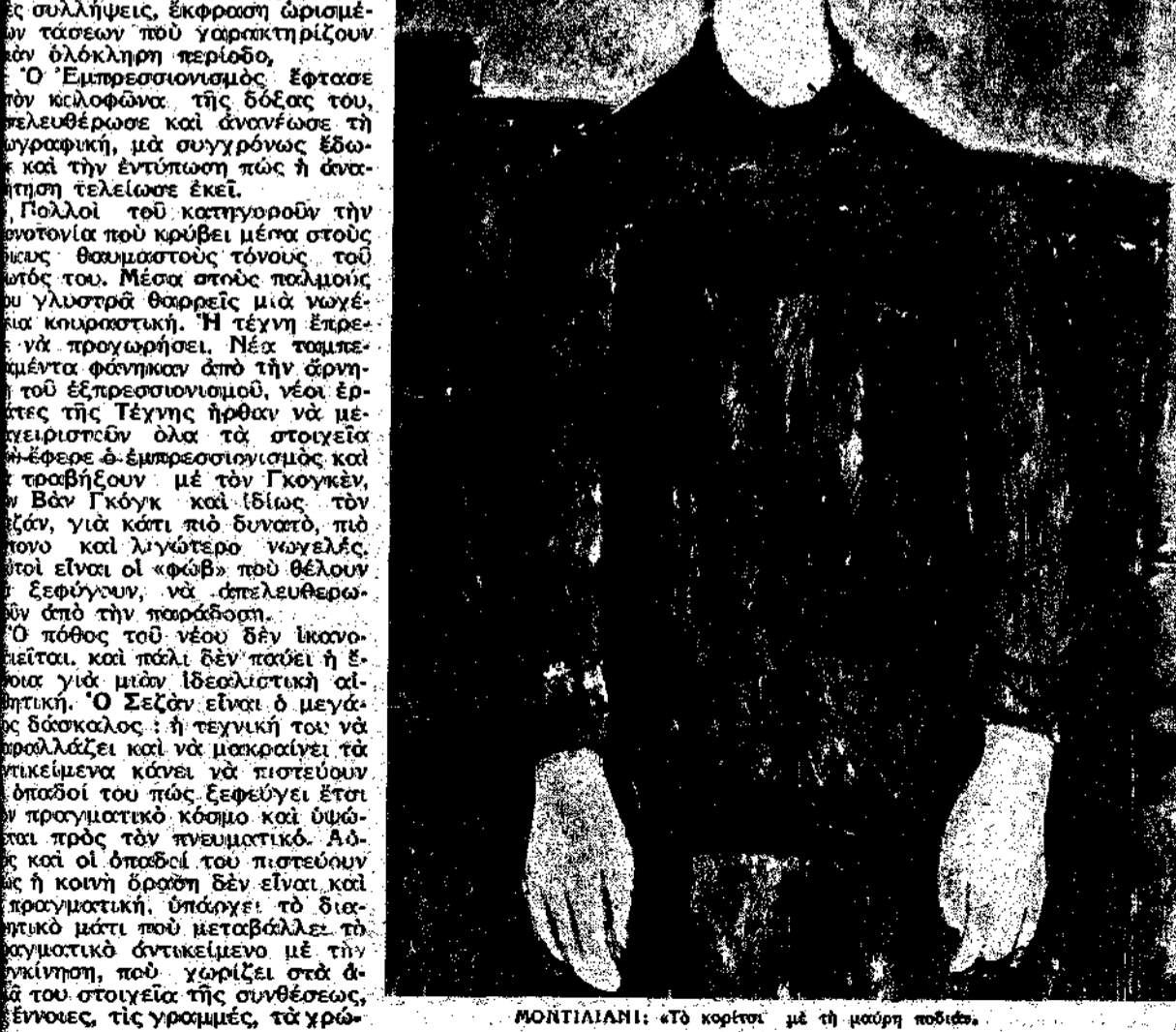
ΜΟΝΤΙΑΛΙΑΝΙ: «Το κορίτσι με τη μαύρη ποδιά»