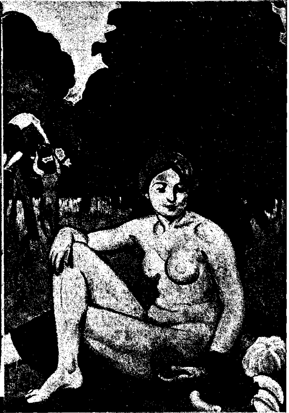
Ρ. ΝΤΕ ΛΑΦΡΕΣΝΕΪΤ: «Επινοήματα από τα νεκρά»