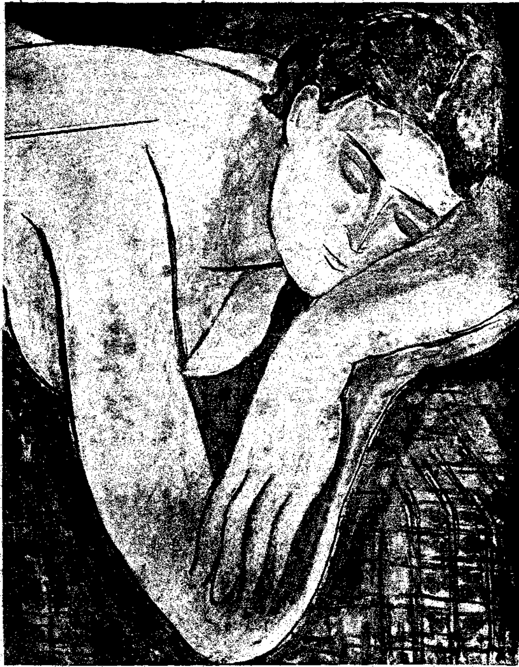
ΑΥΓΟΥΣΤΟΣ ΡΟΔΙΝ: «Το σκεπτόμενος»