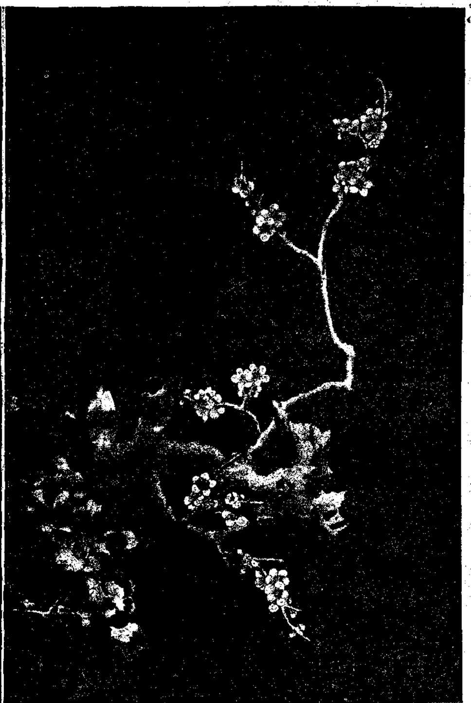
ΑΡΙΣΤΕΡΑ: Κυρία έπάνω σε νιβάνι με το παιδί της και τη θεοπαί'δα. Ζωγραφική σε μετάξι. Δυναστεία Μινγκ (1368 — 1643 μ. Χ.). ΔΕΞΙΑ: Τέσσαρες σπουργίτες έπάνω σε γινοσοκέπατο εθθισμένο κλαδί αγριοδομασκηλιάς. Ζωγραφική σε μετάξι. Δυναστεία Σούγκ (960—1279 μ. Χ.).