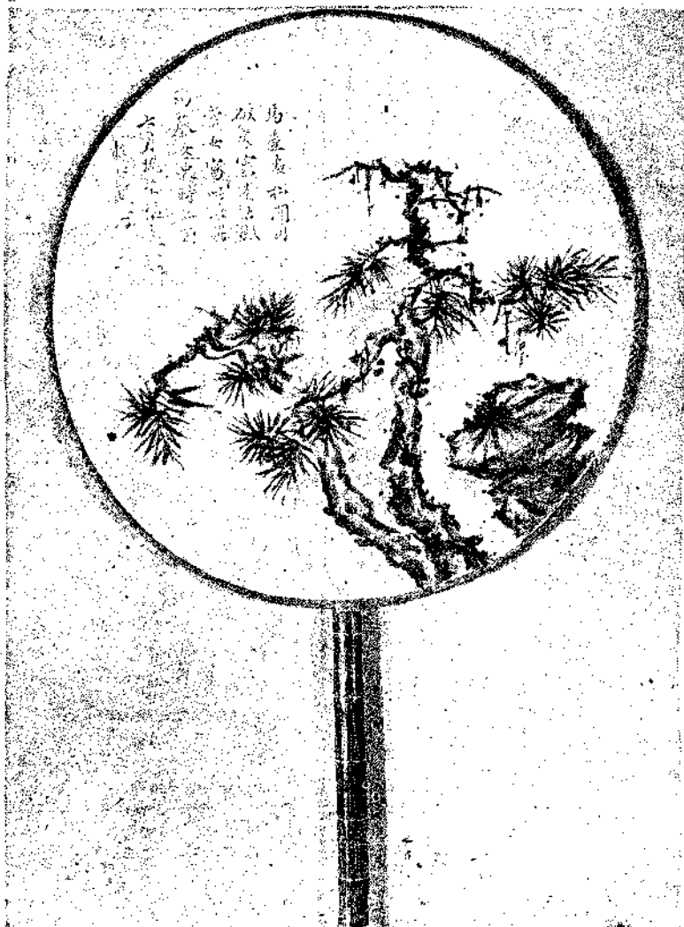
Βεντάγια ζωγραφισμένη από τον σύγχρονο κινέζο καλλιτέχνη Λιγκ Τζουτ Γόνγκ, με καλλιγραφικά σχόλια από τον πατέρα του ζωγράφου. 'Η βεντάγια αυτή είναι έργο αέροσχεδιασμού και γίνηκε πρότεροι σε μία καλλιτεχνική συγκέντρωση στο Πεκίνο.