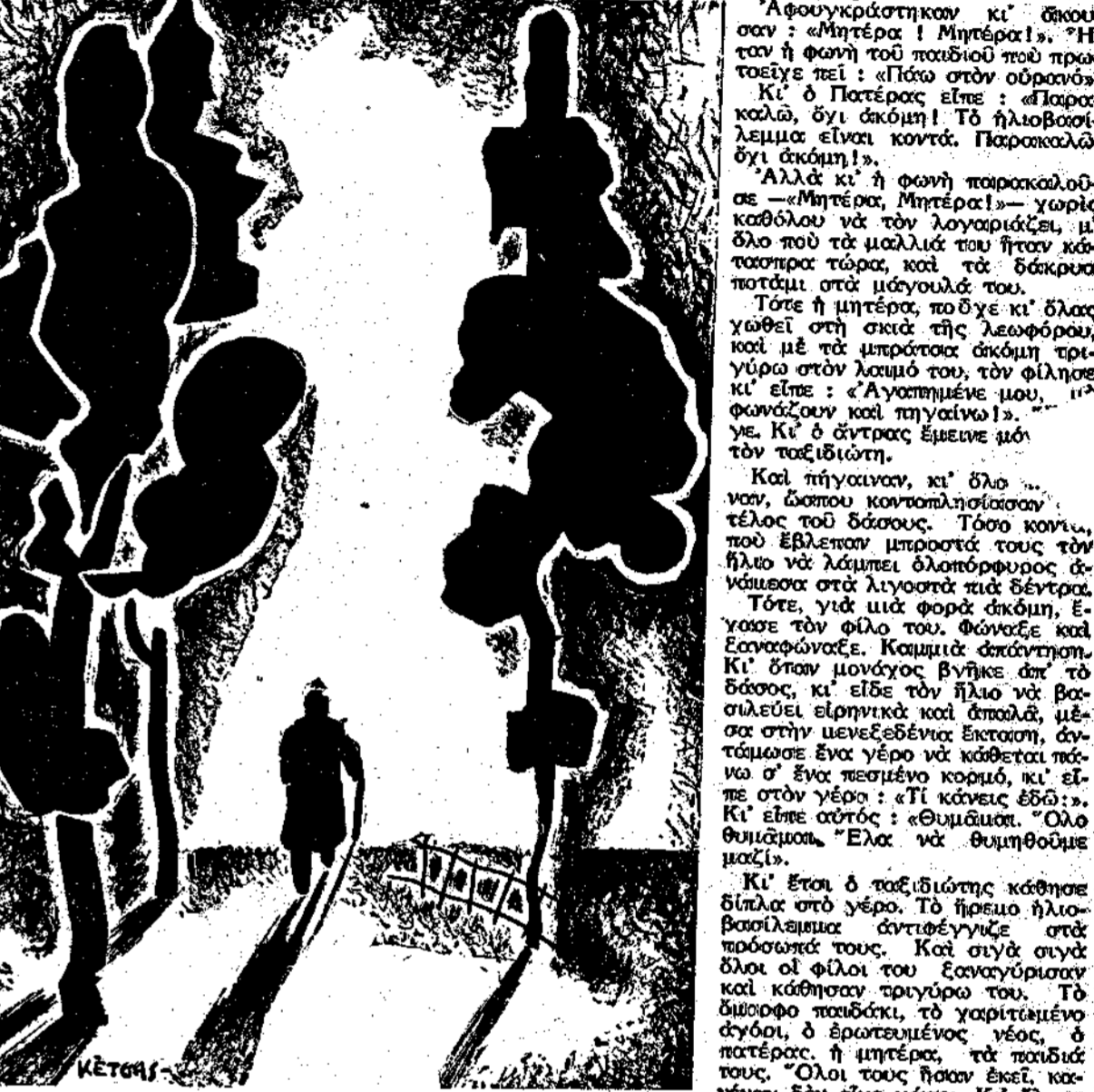
Σκίτσος του κ. Α. Κίση