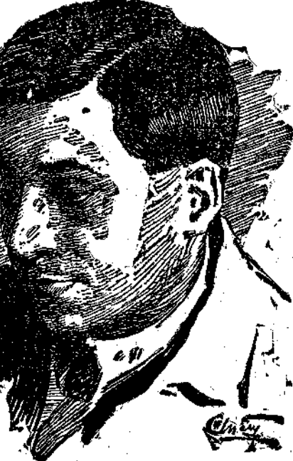
Ο ΜΙΧ ΖΟΣΤΖΕΝΚΟ