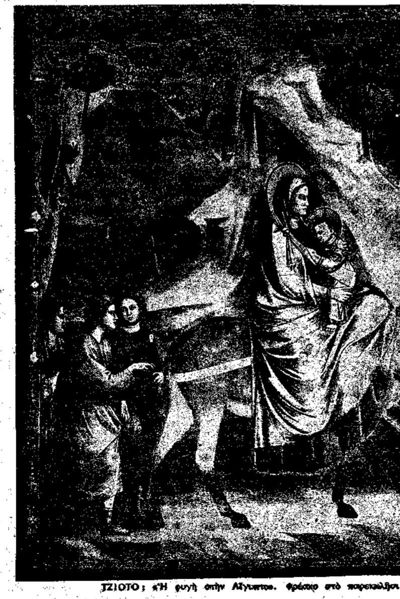
ΣΤΙΟΤΟ: «Η φυγή στην Αλγυρία» φράσκα στο παρακαλάρι Άρκεν της Πόλο Ροσ