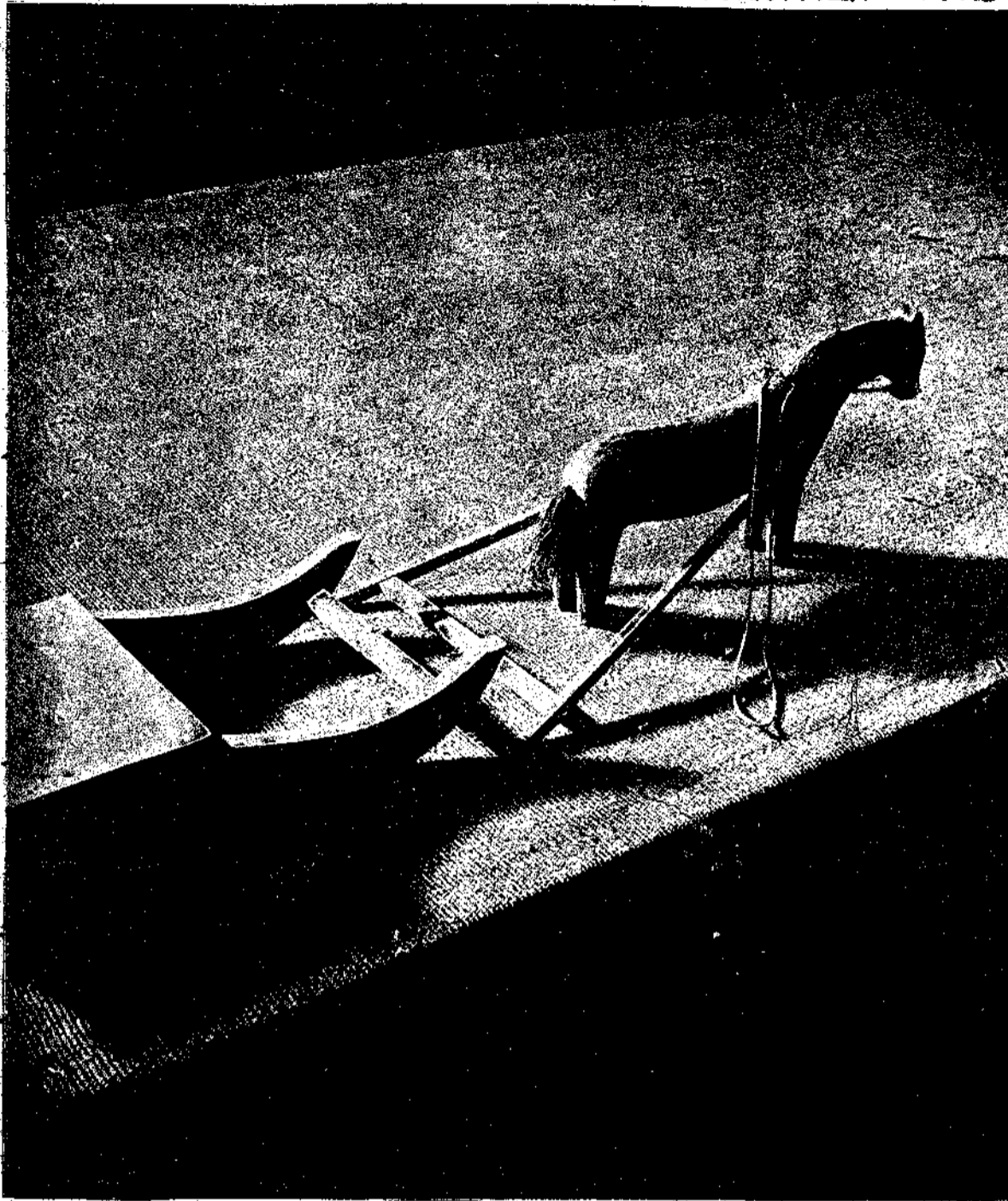
Ξύλινο παιχνίδι με ελικθρο. Έργο του Ι. Έρικσον, αγρότη της Βαϊμλόντ στη Δυτική Σουηδία (1907).