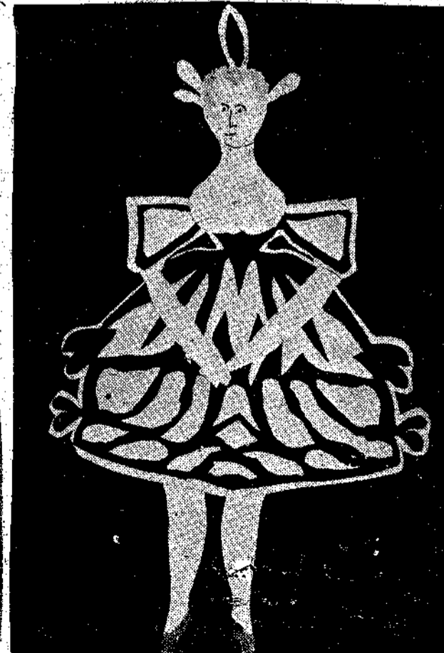
Μιά Βενεζελική Πινωκοθήκη (1839) από χρωματιστό καρτόνι. Ύψος 25 εκατοστά.