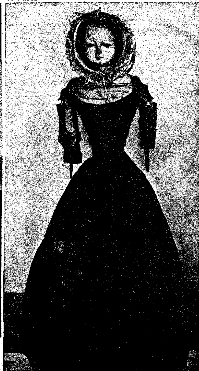
Κοκόλια Έγγλέζικη (περίπου 1740 - Μουσείο της Πόλης του Λονδίνου).