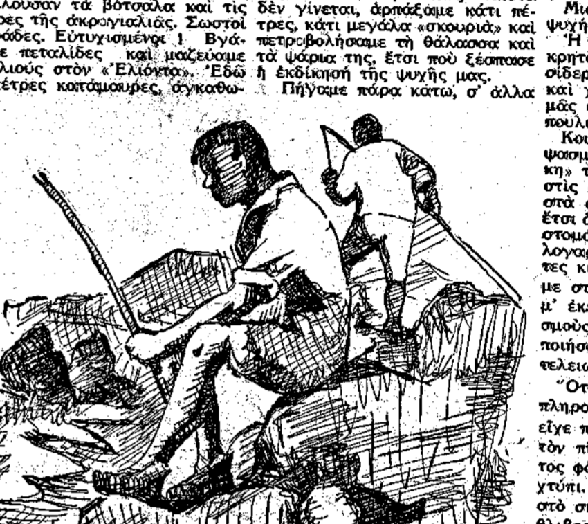
Σελ. 100 της 6.ης Σελήνης