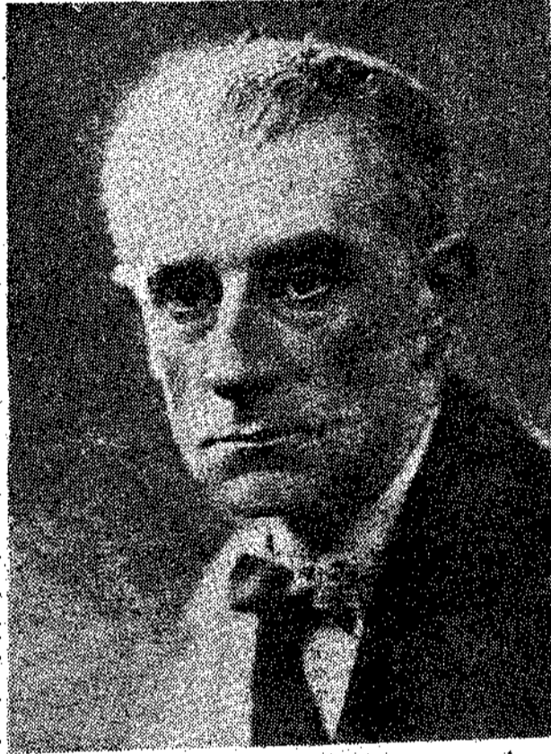
Μία από τις τελευταίες φωτογραφίες του Ραβέλ.

Χωρίς να κάνω γενι- κή μελέτη της τέχνης του Ραβέλ, θάθελα να περιοριστώ εδώ σ' αυ- τή την άποψη, και να σημειώσω ποιά θέση άπόκτησε ή έλληνική έμπνευση στο έργο του, και πώς εκφράζει τη μουσική του αντί- ληψη.