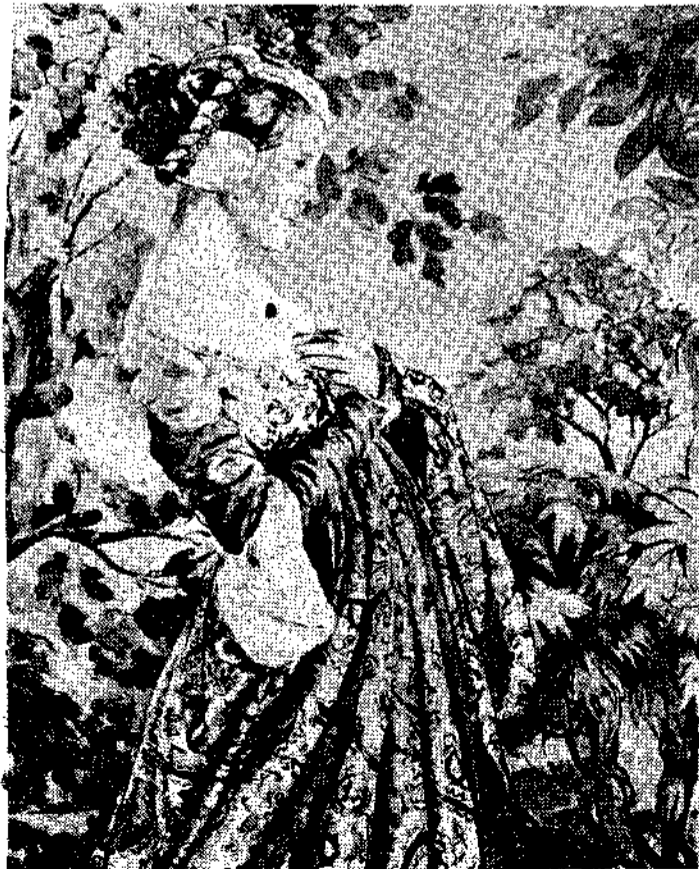
ΝΤΙΝΑΣ ΓΟΥ'ΗΝΓΙΑΡΝΤ: «Πορτραίτο». Από την έκθεση της στην γκαλερί Κολνάγκι τού Λονδίνου.

Άκόμα όμως είναι άγνωστο άν θά παιχθεί μέ δικασική τού ίδιου τού Κοτώ. Είναι γνωστό πώς έργάζεται από χρόνια, μεταφράζοντας και διασκευάζοντας τά έργα τού Σαίξπηρ.