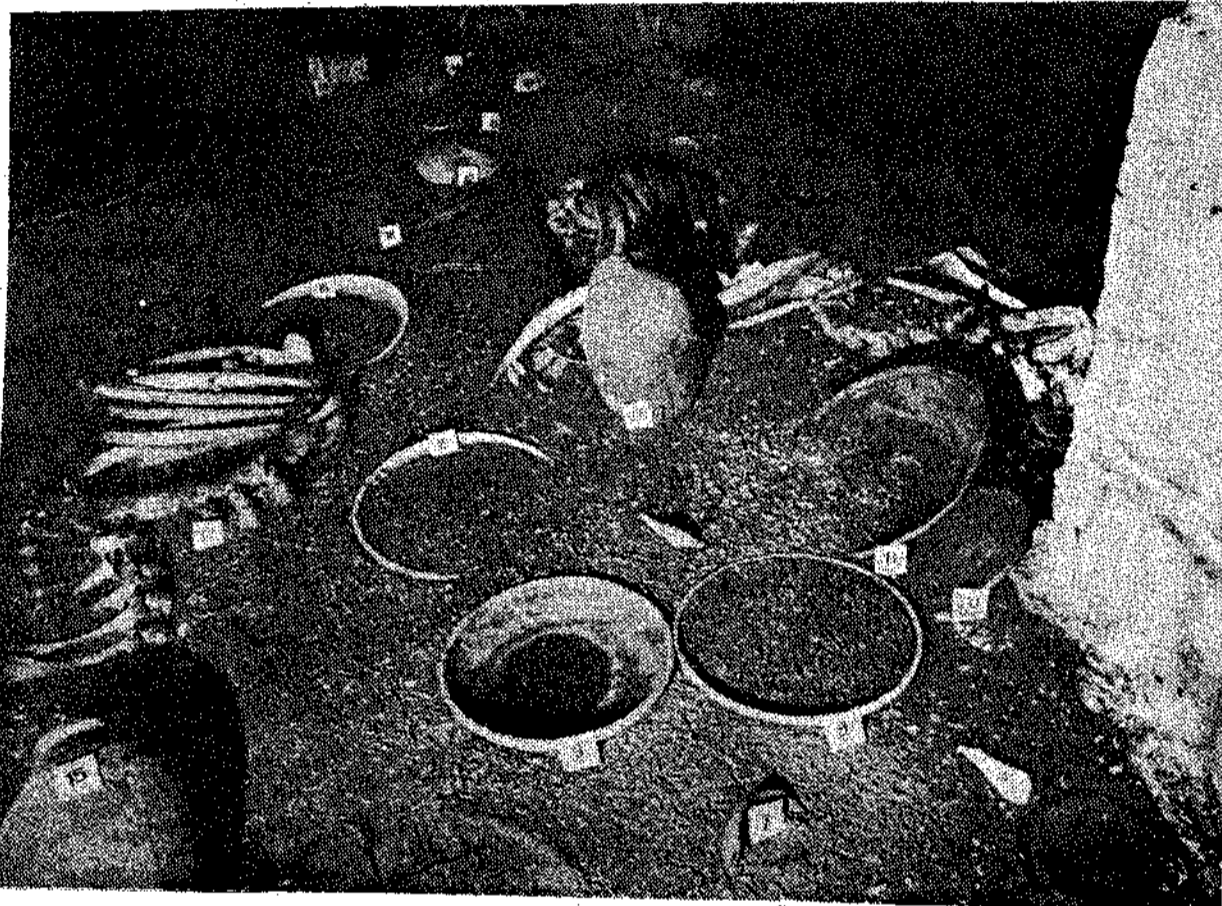
Τάφος της 2ης δυναστείας στη Σακκαρά, η νεκρόπολη της Μέμφιδος με διάφορα εύρηματα. [Βλέπε επίσης την εικόνα της τελευταίας σελίδας].

του ΓΟΥΩΛΤΕΡ Β. ΕΜΕΡΥ φιδος, που η ίδρυση της αποδίδεται στον Μηνά. Στις 20 του Δεκέμβρη 1937, οι ανασκαφές μάς αποκάλυψαν την