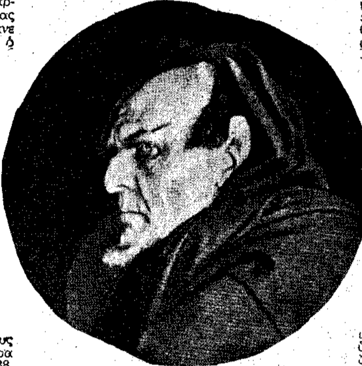
Ο Σαλιάπιν στο ρόλο του Μεριστοφέλη.