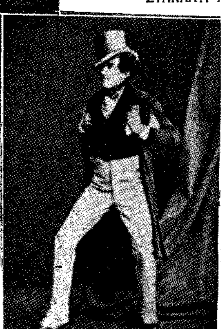
Ποιός με το άνεβασμα του Ίρβιγκ έγινε δημοφιλέστατος στην Αγγλία και σημείωσε καταπληκτική οικονομική επιτυχία. Τον ρόλο της Μαργαρίτας τον έπαιξε η Έλεν Τέρρυ, που είκοσιέσσερα ολόκληρα χρόνια ήταν η συμπρωταίστη του στη σκηνή. 2) Τα σανδάλια αυτά τα πρωτότυπα έφτιαξε ο ήθοποιός Έντμουντ στον ρόλο του Βρούστου. Έπειτα τα φόρεσε ο Ίρβιγκ. 3) Ο Ίρβιγκ στον ρόλο του Κάρολου Α' στο έμωμο έργο, που πρωτοανεβώθηκε στις 28 Σεπτεμβρίου 1872. Παίχτηκε 180 μέρες συνεχώς, πράγμα που για την έποχή εκείνη ήταν κάτι το καταπληκτικό και γι' αυτή την Αγγλία. 4) Ο Ίρβιγκ στον ρόλο του Τζαίμς στην θεατρική δισκοική του έργου του Ντίκενς «Αλικούικ». Πρωτοπαίχθηκε στο 1871.