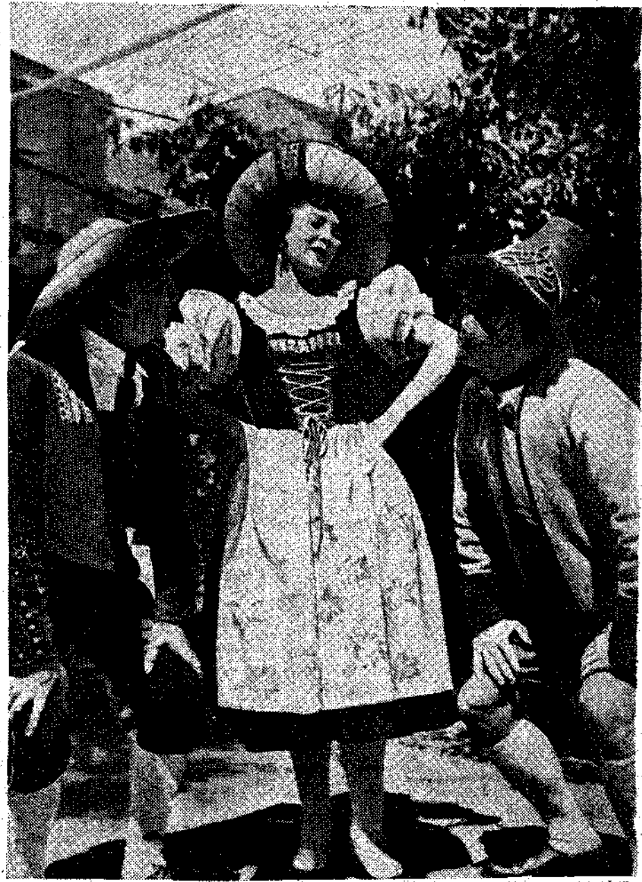
Χωρικοί του Τυρόλου της Αυστρίας