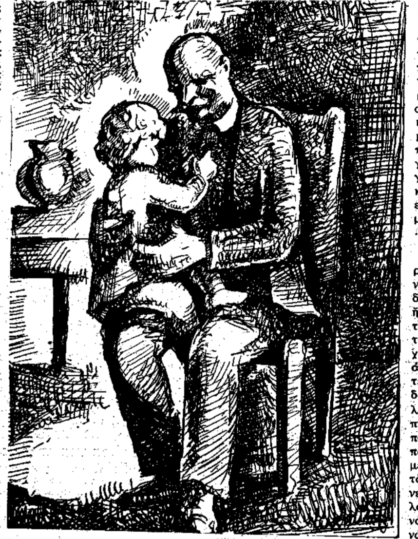
(Σελίδα 8. Ἀπρίλ. Στιμῆτος)