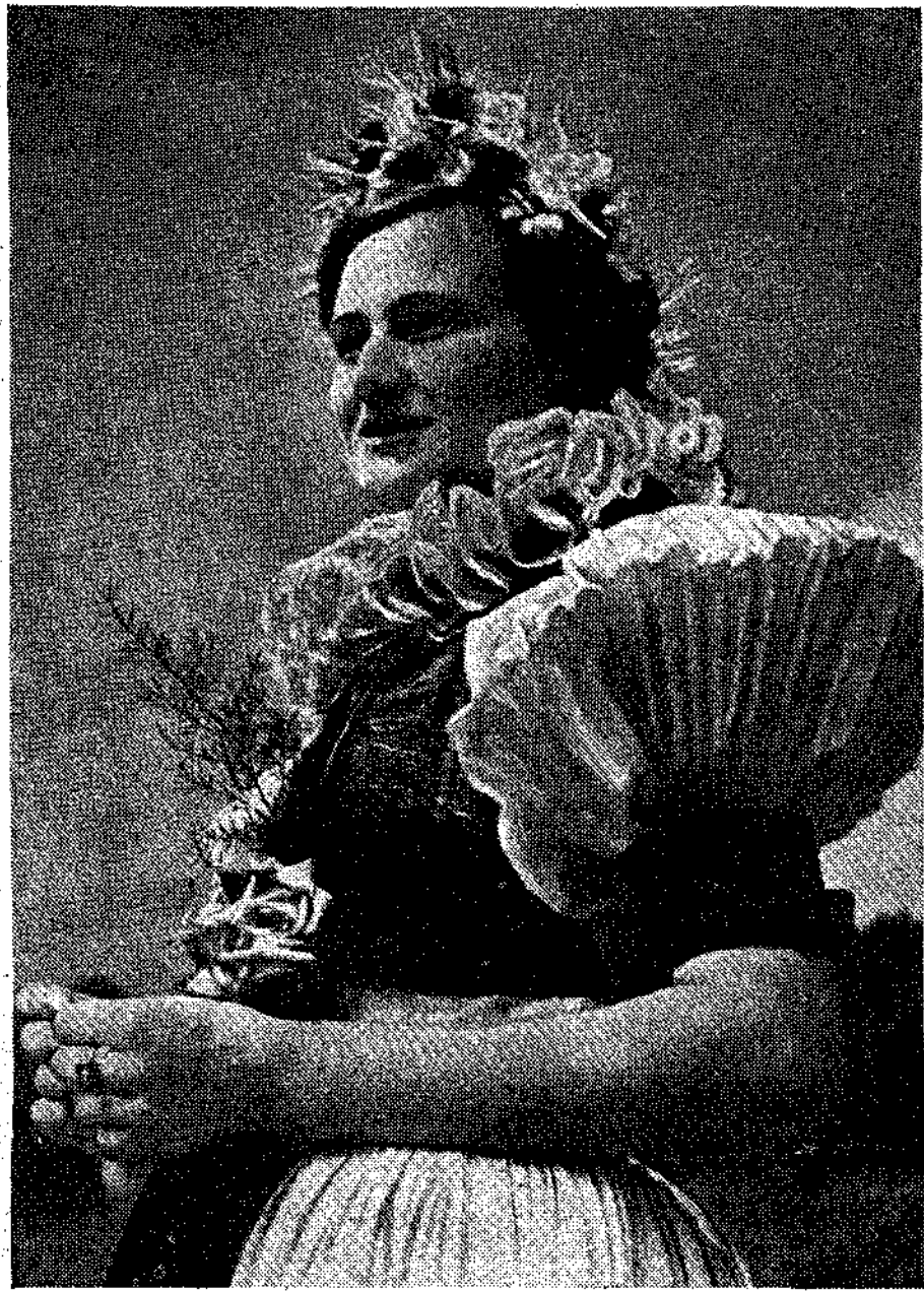
Χωρική της Τσεχοσλοβακίας (Μοραβία).