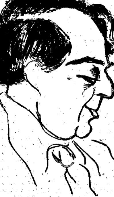
Ο ΦΩΤΟΣ ΠΟΛΙΤΗΣ

θανάτια κι' απαλλαγμένη τώρα από κάθε θολό πλαίσιο όγλοφοής, ένα σπαθί άστραφτερό κι' ήρθιο, άρρενωπό ήρθιο, που βγαίνει μέσ' από έναν τάφο. Κ' η λάμψη του άτσαλιού, δίχως να μας τυφλώνει τώρα, μάς δείχνει σταθερά το δρόμο για την ανακάλυψη του πνευματικού εκείνου αθλητή που το κρατούσε, του ανθρώπου που πέρασε ανάμεσα μας άγνωσμένος μόνο και μόνο γιατί τον ένομιζαμε πολύ γνωστό.