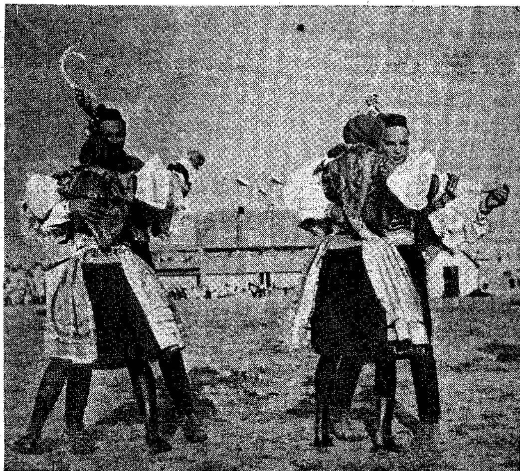
Βοημικοί χοροί μ' εθνικές ενδυμασίες