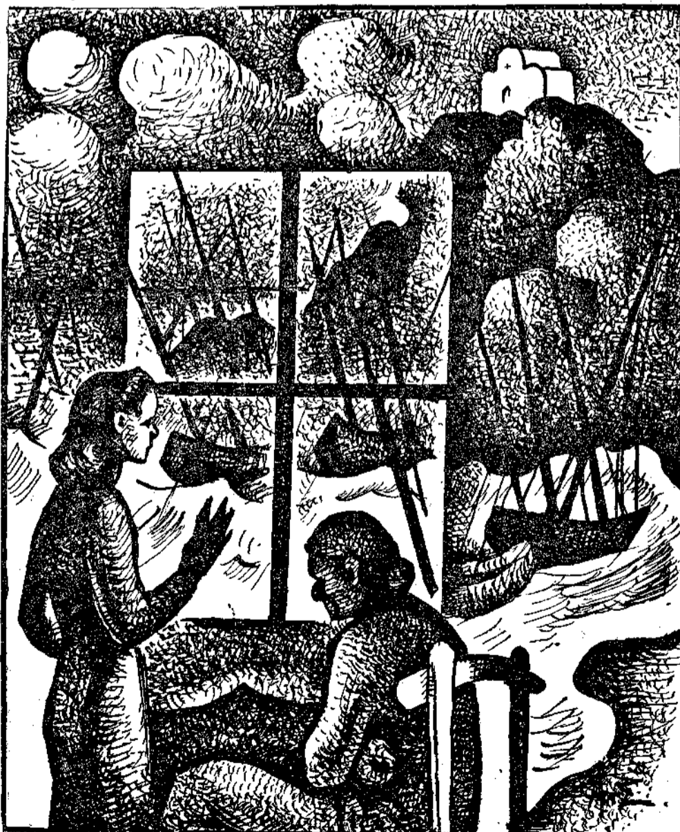
Σκίτσος της β. 'Αρ. Στριφτού για το ερώτημα από το μυθιστόρημα «Γαλήνη» του Ηλία Βενέζη

(Απόσπασμα από το νέο μυθιστόρημά του που κυκλοφορεί την ερχόμενη εβδομάδα).