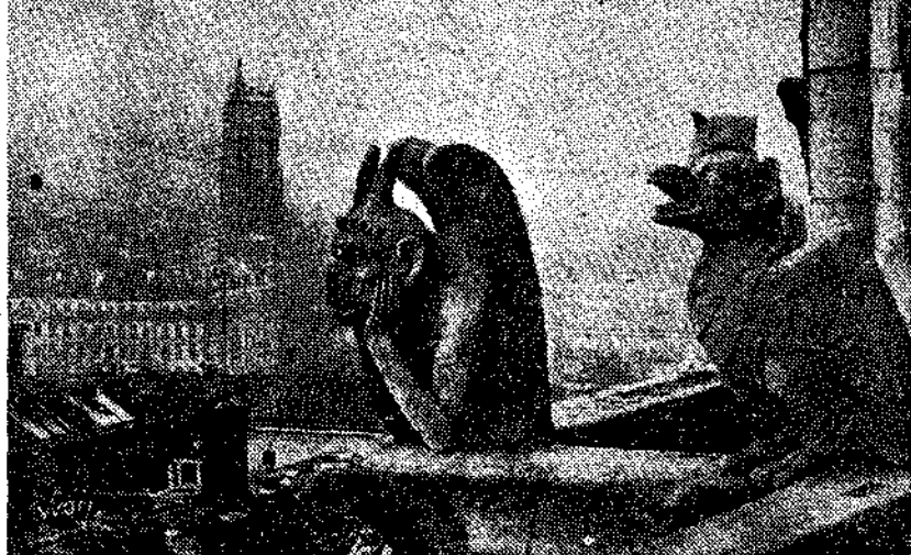
Λεπτομέρεια της Παναγίας, των Παρισίων.

Nautae Parisii, Έγραφε τό πρώτο μνημείο που έστησαν κίπριοι ναυτιλοί Γαλάτες στην άκρη της Σιτέ. Έχουν έρθει από τη χώρα που βασίλευε ο αυτοκράτορας Τιθέριος και διάλεξαν την Ήσαία νησίδια της Σιτέ, για να στήσουν τό μνημείο τους στο Δία. Ναύτες, παιδιά του λαού. Έδωσαν τό όνομα στην πόλη που δέν πήρε ποτέ όψη ρωμαϊκής «Urbis». Όσο κι' άν τό Παρίσι έγινε με τόν καιρό μεγάλη μόντερνα πρωτεύουσα, κράτησε ανέπαφη την παλιά κοίτη που του χάρισαν στο διάβα τους οι αιώνας. Μένουν ακόμη οι μπωμπέ, οι όνειροπόλοι της Σαίντ — Ζενεβέ:έδ, οι Βωτρέν και οι Ρα-