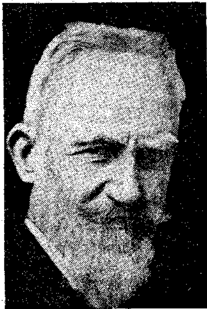
Ο Μπέρναρ Σώ.

κάτι τό περίτεχνο και τό πνευματώδες μαζί. Δέν έχει σχέσεις με την έποχή του, δέν τόν ένδοφάρουν τα κοινωνικά και τα ήθικά προβλήματα. Άν δέχεται τόν σοσιαλισμό, τό κάνει μόνο και μόνο γιατί πιστεύε: