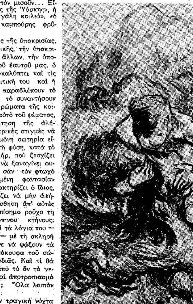
BAN GROFK: «Ο θεοτίστης.