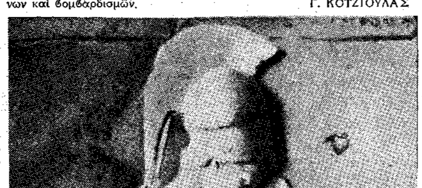
Η Παλλάδα Άθηνά, προστάτρια των Άθηνών.