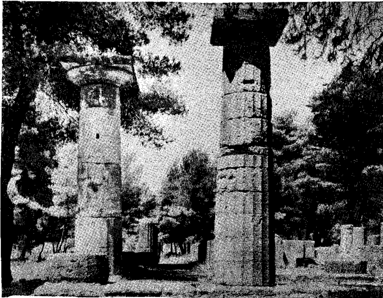
Αυτή της Έλλάδα γυρεύουν να καταστρέφουν οι επιδρομείς.

των παλαιών Ρωμαίων. Όπως έκείνοι λεηλάτησαν όσα μόρεσαν έργα τέχνης και τ ά πήγαιναν στην πατρίδα τους.