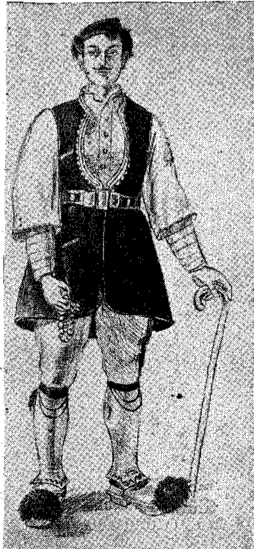
Φορεσιά του χωριού 'Αναρτικό της Φλώρινας-Μακεδονία.