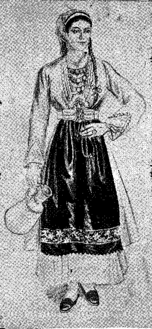
Φορεσιά του Σουλίου — Θράκη.