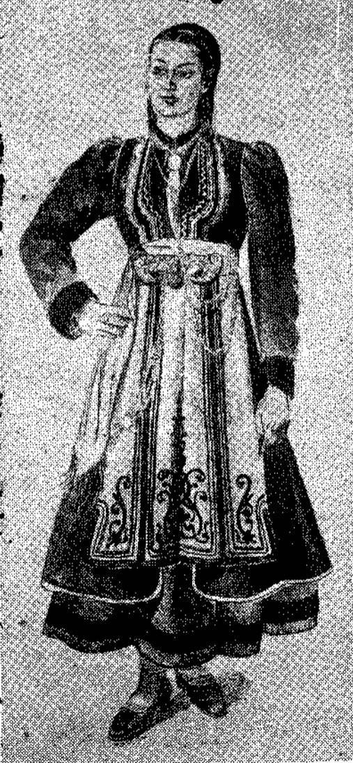
Φορεσιά Δόδας Κορυθιάς—Β. 'Ηπειρος.