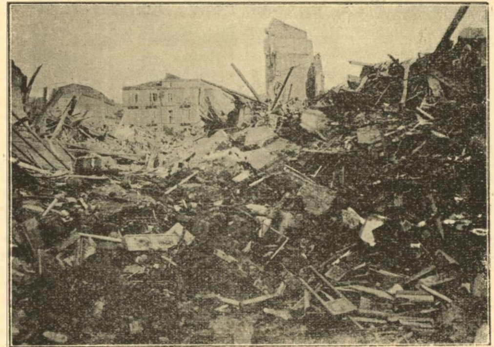
Ἡ ὁδὸς τῶν Ἑλλήνων

θαλάσσιου σεισμοῦ εἶνε ἡ αὐτὴ μετὰ τὴν ταχύτητα τῆς μεταδόσεως τοῦ ἤχου ἐν τῷ ὕδατι, ἦτοι 1434 μέτρα κατὰ δευτερόλεπτον, τὸ θαλάσσιον σεισμικὸν κύμα ἐπῆλθε κατὰ τῆς χέρσου, οὐκ ἰσχυρόν μετὰ τὸν τῆς χέρσου σεισμὸν (5.22' Π. Μ.), ἀλλὰ βραδύτερον, ἀναλόγως τῆς ἀπὸ τοῦ ἐπικέντρου ἀποστάσεως τῶν διαφόρων ἀκτῶν. Προσέτι τὸ θαλάσσιον σεισμικὸν κύμα, ὕπερ κατέκλυσε τὰς ἀκτὰς τῆς τε Καλαβρίας καὶ Σικελίας, εἶχεν οὐ μόνον διάφορον ὕψος εἰς τοὺς διαφόρους τόπους—οὕτω π. χ. ἐν Μεσσηνίᾳ