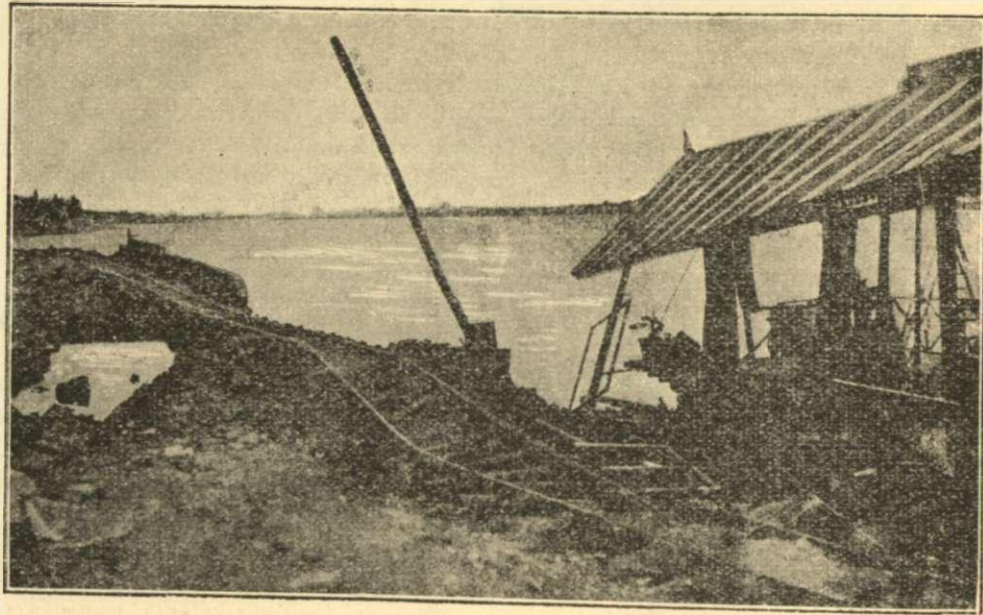
Κυρτώσεις τῶν γραμμῶν τοῦ τροχιοδρόμου Μεσσηνίας

Ἐπίσης ἀνάλογον φαινόμενον διασώσεως ἐν-