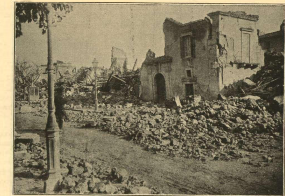
Ὁ Ἑλληνικὸς ναὸς τοῦ Ἁγίου Νικολάου

κεμβρίου σεισμοῦ καὶ κατ' ἀκολουθίαν καὶ οἱ θαλάσσιοι σεισμοὶ ἦσαν ὑποδεέστεροι τοῦ πρώτου.