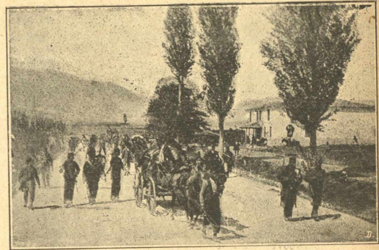
Ὁδὸς ἄγνοια εἰς Τύρναβον τῆς Θεσσαλίας

«Ἐν τῷ στρατοπέδῳ, ὅταν δὲν ὑπάρχῃ μάχη ἢ