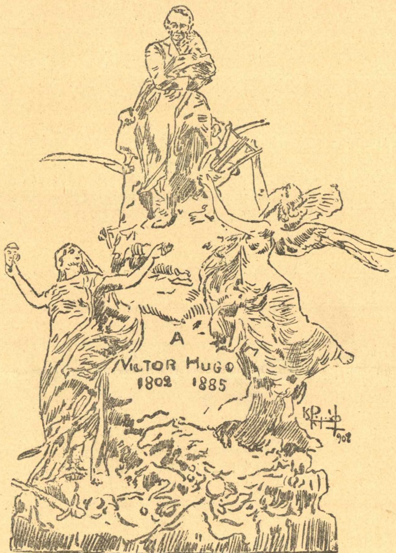
Τὸ μνημεῖον τοῦ Βίκτωρος Οὐγκώ.