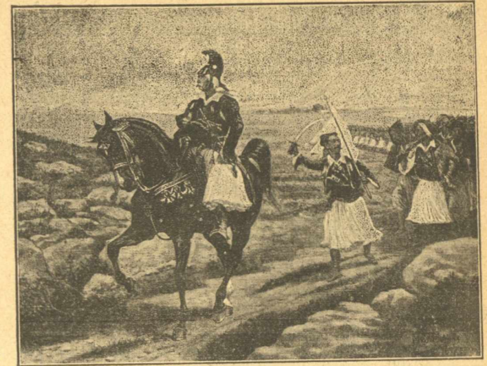
Ὁ Κολοκοτρώνης ὀδηγῶν τοὺς Ἕλληνας.

Ὅτε πρὸ δωδεκαετίας περίπου μοὶ ἀνετέθη, χάρις εἰς τὴν πρωτοβουλίαν τοῦ μεταστάντος ἐθνικοῦ εὐεργέ- του Κ. Ζάππα, ἡ σπουδὴ τῆς δασολογίας, εὐρέθη ἐπάνω κάτω εἰς τὴν αὐτὴν θέσιν, εἰς ἣν θὰ εὐρίσκεσθε καὶ σεῖς σήμερον, φίλτατοι ἀναγνώσταί, ἂν σᾶς ἤρῳα