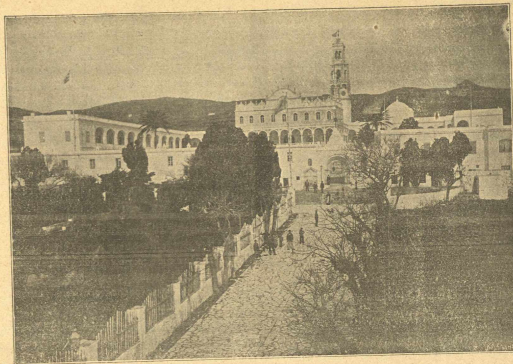
Ὁ ἐν Τήνῳ ἱερός Ναὸς τῆς Εὐαγγελιστριάς.

Ἀπεθαύμαζον τὴν ἀπὸ τοῦ Ἄρμενιστῆ σκηνογραφίαν. Μεγαλεῖον ἐξ ὑπαμοιβῆς ἀγρίων καὶ πρᾶον ἀποπνέει ἡ τοπογραφία. Κάτω βρυχᾶται τὸ κῦμα. Ἐμπλεον θυμοῦ ἐπέρχεται μανιωδέστερον, πλήσσει τὸν βράχον καὶ ὀπισθοδρομεῖ διὰ νὰ ἐπιπέσῃ ὀρμητικώτερον. Ἄλλ' ὁ γίγας ἀπροσπεκτεῖ εἰς τὰς ὁρμὰς τοῦ παιδίου. Βαθεῖαι χαράδραι, δυσχερεῖς τὴν ἀβόδον, εἰς ὑψηλὰς καὶ ἐπιμήκεις ἐσοχὰς σχίζουσι τὴν περιοχὴν. Αἰώνιος μυχιδὸς ἀκούεται ἐκεῖ, ἀπὸ τῶν ἀνακυκωμένων σπλάγγων ἀειταράχου θαλάσσης ἐκπορευόμενος. Οἱ ἀκανθῶδεις θαμνίσκοι οἱ μόλις καὶ ἀραιῶς ὑφέροντες εἰς τὰ ἀνώτατα τοῦ ἀκρωτηρίου στρώματα, σαλεύονται μέγρις ἐκπάσεως ἀπὸ τοῦ ἀκατασχέτου βορρᾶ. Ἐρημία κρατεῖ εἰς τὴν ξηράν, καὶ ἐρημία ἀπλοῦται εἰς τὴν θάλασσαν. Ἄλλ' ἐν μέσῳ τῆς ἐδιπλῆς ἐκείνης ἐρημίας ὁ ἄνθρωπος δὲν εἶνε μόνος ἐκεῖ. Ἐχεὶ τὴν συντροφίαν τῆς φύσεως, τὴν μεγαλοπρεπῆ καὶ αὐστηρὰν τῶν στοιχείων μουσικὴν, ἀλλ' ἔχει ἰδίως τὸν ἴδιον ἑαυτοῦ ἐνδόμυχον κόσμον, ἐντὸς τοῦ ὁποῦ ζῆ. Πάσχει, ἀπολαμβάνει, χαίρει, οὐδύρεται καὶ μελετᾷ. Ὁ ἐτωτερικός κόσμος! Καὶ ποῖος δὲν ζῆ κατὰ προτίμησιν ἐντὸς ταῦ κόσμου τούτου! Καὶ ποῖος δὲν ἠσθάνθη τὴν εὐφρόσυτον ἠδονὴν καὶ τὸ ἄλγος ἐναλλάξ τοῦ κόσμου, οὗτινος αὐτὸς ὑπῆρξεν ὁ δημιουργός, καὶ ὃν διὰ τῆς ἰδίας βουλήσεως καὶ τοῦ ἰδιοῦ πνεύματος φωτίζει καὶ σκοτίζει, αἶρει καὶ ταπεινοῖ, θεμελιοῖ καὶ συντρίβει! Καὶ ποῖος ἐνώπιον τῶν μεγάλων φυσικῶν σκηνῶν καὶ ἀλλοιώσεων, ἀποθαυμάζων τὰς ἀδιαλείπτους ἐναλλαγὰς τῶν πρὸ αὐτοῦ φαινόμενων, δὲν συνεστᾷλη