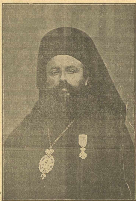
Ὁ Μητροπολίτης Ἀθηνῶν Θεόκλητος Μηνόπουλος.