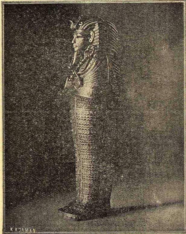
Τὸ πάγχρυσον ἀνθρωποειδὲς φέρετρον τὸ ἐγκλείον τὰ ταριχευμένα ἐντόσθια τοῦ Τοῦτ - Ἄνκ - Ἀμμὸν.

σκήπτρον, εἰς δὲ τὴν ἑτέραν τὰ μαστίγια, τὰ σύμβολα ταῦτα τῆς βασιλικῆς ἐξουσίας. Εἰς τὰ μεταξὺ τῶν λινῶν ἐπιδέσεων διὰ τῶν ὁποίων εἶχε περιτυλιχθεῖ τὸ τεταριχευμένον σῶμα τοῦ Φαραῶ ὑπῆρχαν κατεσπασμένα διάφορα πολυτιμώτατα κοσμήματα, περιδέραια, δακτύλια κλπ. ἐκ χρυσοῦ καὶ πολυτίμων λίθων. Ἡ μούμια τοῦ Τοῦτ - Ἄνκ - Ἀμμὸν ἂν καὶ ἀπὸ τοῦ ἐνταφιασμοῦ τῆς