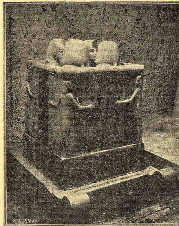
Ἡ λάρναξ μὲ τὰ 4 πόματα τῶν Κανωπικῶν ἄγγεϊων, τὰ ὁποῖα εἶναι μικρὰι προτομαὶ τοῦ Φαραῶ ἐξ ἀλαβά- στρου. Εἰς τὰς πλευρὰς αἱ 4 προστάτιδες Θεαί.

Ἡ 18η δυναστεία εἶνε μία τῶν λαμπροτέρων δυνα- στειῶν τῆς ἀρχαίας Αἰ- γύπτου, ἣ ὁποία ἔδω- κεν εἰς αὐ- τὴν μεγά- λους ἡγεμό- νας ὅπως εἶνε ὁ Ἄ- μένοφις ὁ Ἄος ὁ ὁποῖ- ος κατέκτη- σε τὴν Συ- ρίαν καὶ ἐξέ- τεινε τὴν ἐπιρροὴν τοῦ Ἐυφρά- του, ἐπίσης ἢ μεγαλεπί- βουλος βα-