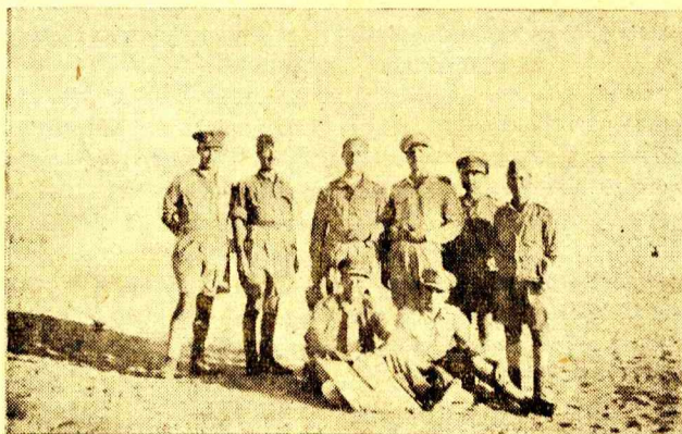
Σεπτέμβριος του 1942. Πρώτη γραμμή του μετώπου του 'Αλαμείν. Κεντρικός τομεύς. 'Ο ύπουργός τής 'Εθνικής 'Αμύνης Παν. Κανελλόπουλος (στο μέσον άσκεπής), δεξιά ό Ταξιαρχος Κατσώτας, και άριστερά ό επιτελάρχης τής Ταξιαρχίας συνταγματάρχης του πυροβολικού Λάϊος, και τ' άλλα μέλη του 'Επιτελείου τής Ταξιαρχίας.

Στρατηγός Τέντερ (άρχηγός τής 'Αεροπορίας Μέσης 'Ανατολής): «Είμαστε άληθινά εύτυχείς πού ή Βασιλική 'Ελληνική 'Αεροπορία ήταν σε θέση νά λάβει μέρος στις επιχειρήσεις. Τό καθήκον της τό εξέτέλεσε με μεγάλη γενναϊότητα. Χαιρόμαστε και ύπερηφανευόμαστε πού τήν έχουμε μαζί μας».