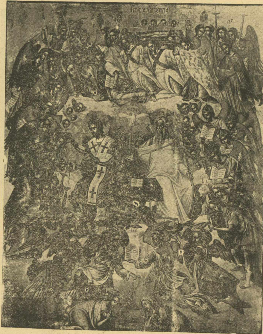
«Η Θεία Λειτουργία» του Μιχ. Δαμασκηνού, εκ της όπερας ό χορός των Άγγέλων ενέπνευσε πολλάκις τον Γκρέκο.

όλην την πεφωτισμένην εργασία πολλών. Λοιπόν: Πάντων τούτων την επίλυσιν ός επίζητήσωμεν άρχόμενοι όπό την Βυζ. Τέχνην της Κρήτης. Πρό μικρού έπανήλθον από την νήσον ταύτην έπισκεφθείς μέρη τια άπαραίτητα. Την Κρήτην γεν.κώς έχει μελετήσει ό Γερόλα και έχει γράψει τό περίφημον αυτό ββλίον Monumenti Veneti.