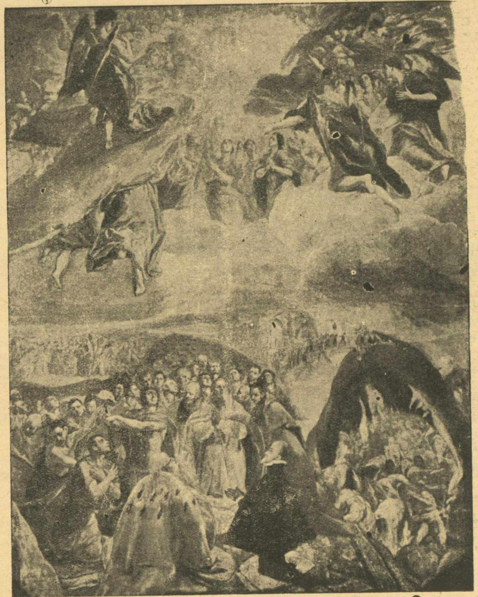
Περίφημος εικῶν του Γκρέκο εις την όποιαν διακρίνεται καθαρά ή επίδρασις του Μιχ. Δαμασκηνού.

Άλλ' εκτός αὐτῶν, ύπάρχουν και έπιγραφαί έτι παλαιότεραι, ήτοι του 1332. Έπομένως πιστοῦται ότι ό ως νέος άγιος θεωρούμενος Φανούριος είναι παλαιότατος αναγόμενος εις τον ΙΔ' αϊώνα. Άλλ' εκείνο τό όποιον έμποιεί έντύπωσιν είναι ού μόνον αί τοιχογραφίαι του Ειρήκου τούτου ωραιότατοι και τυπικότητης εκτελέσως άλλα και οι φορηταί εικόνες του Άγγέλου,