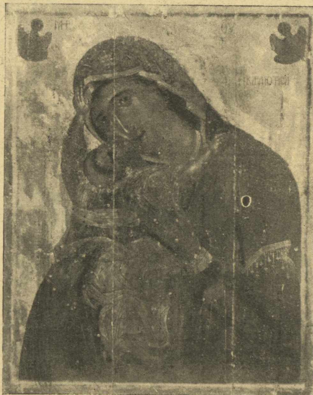
Θαυμασία εικών τής «Γλυκοφιλούσης» του μεγάλου ζωγράφου Άγγέλου (121' αίων) διδασκάλου του Δαμασκηνού.

Ό κλίβανος όστος ήμικυκλικός άπετελειτό από διπλήν σειράν έδάφους και έφάσσετο κατά τόν χρόνον τής θερμάσεως διά φράγματος. Εις τό άνω έδαφος κατά τό μέσον έτίθετο ή έγχρωμος κόνις και κάτωθεν ή θερμαντική ύλη τών άνθράκων. Η κόνις τηκομένη μετεβάλλετο εις έγγχρωμον πλακοϋντα πάχους 10-12 χιλ. ό όποιος μικρόν πρό τής πήρουσ ξηράσεως αυτού οι δεξωόργάνου έχαρασσετο ή διαγωνίως ή κυκλικώς ή επαλληλώς ούτως ώστε να άποτελεσθώ λιν σειράι αύλάκωνεις