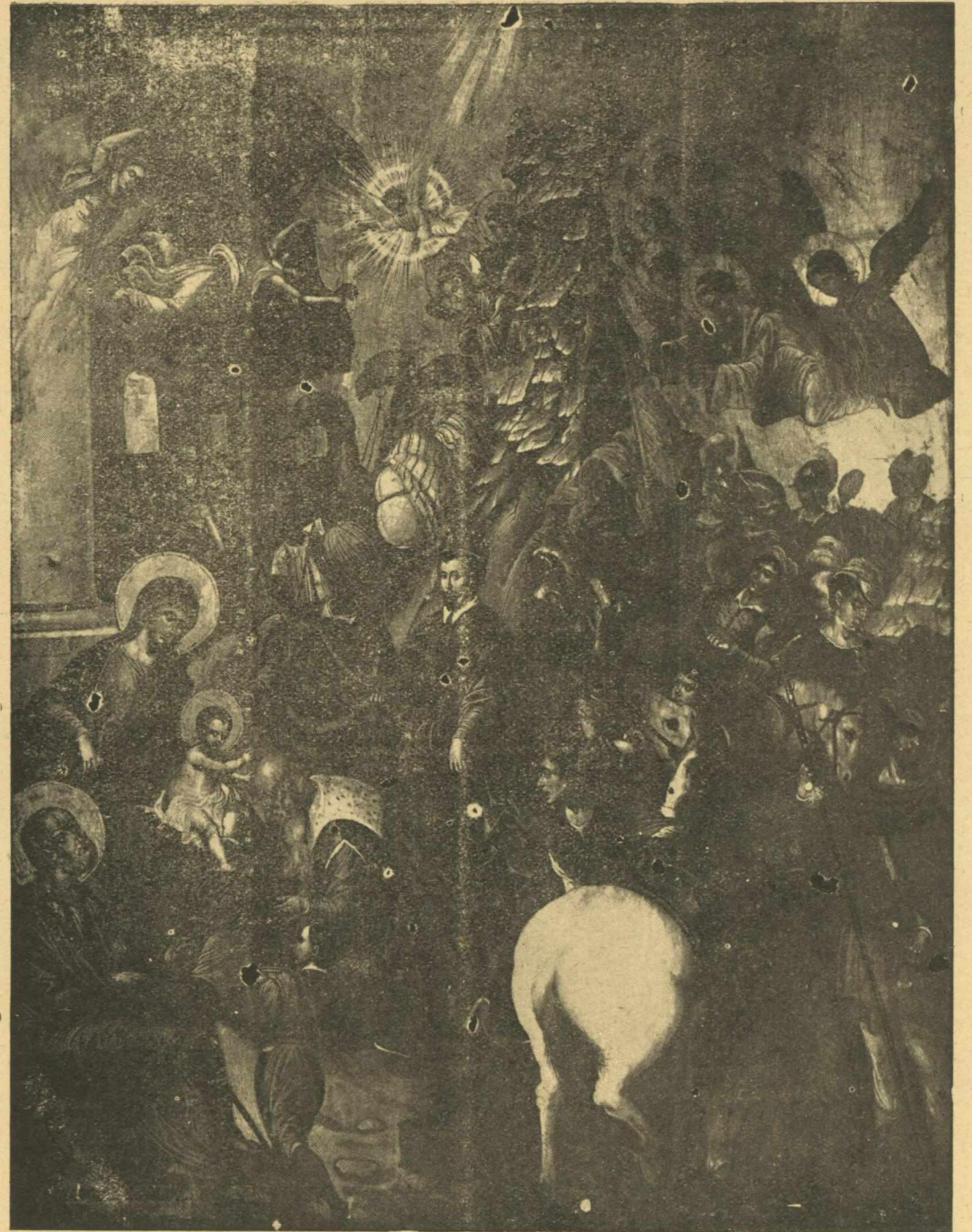
Λαμπροτάτη εἰκὼν τοῦ Μιχ. Δαμασκηνοῦ (1570) εὐρισκόμενη ἐν Κρήτῃ, τὴν ὀπίαν ἐπιμήθη ὁ Greco.

δὲ γεγονός τῆς ὑπάρξεως εἰδικῶν κεραμοουργῶν καὶ κεραμοποιῶν ἐν Ἑλλάδι, δὲν εἶναι μοναδικόν ἀλλὰ τουναντίον ἐπιμαρτυροῖ περὶ τῆς ἀξιοῦσης ἐνταῦθα τοιαύτης τέχνης. Ὁ Μιλλέ εἰς τὸ περίφημον αὐτοῦ βιβλίον ἢ «Ἑλληνικὴ σχολή» (Ecole Grece) ἀναφέρει, ὅτι ὁ Κωνσταντῖνος ὁ Κοπρώνυμος περὶ τὸ 765-6 θέλων νὰ διορθώσῃ τὰ τείχη τοῦ Οὐάλεντος, ἐκάλεσεν ἐξ ὅλων τῶν μερῶν τῆς Αὐτοκρατορίας, εἰδικούς τεχνίτας οἰκοδόμους χριστοῦς, ὁ πέρας κλπ, Ἐκ δὲ τῆς Ἑλλάδος εἰδικῶς ἐκάλεσεν πεντακοσίους κεραμοποιοὺς καὶ διακοσίους ὀστρακαρίους. Τὸ γεγονός τοῦτο καταδεικνύει τὴν μεγάλην εἰδικότητα τῶν Ἑλλαδιδῶν εἰς τὴν ἐργαστηριακὴν τέχνην τῶν κεράμων,