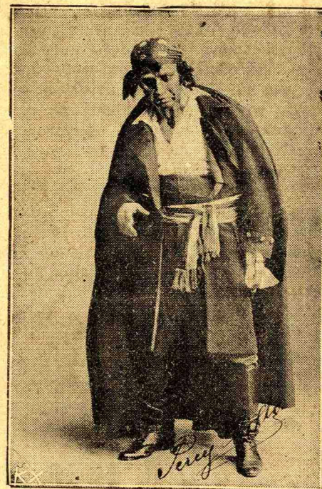
Εἰς τὸν ρόλον τοῦ Ὁρκο «Piccolo Marat»

πρῶτον εἰς τὸ θέατρον «St Carlo» τῆς Νεαπόλεως εἰς τὸν «Mefistofele» τοῦ Boito, ἀποσπᾶσας ἀμέριστον τὴν εὐμενὴ κρίσιν τῶν ἀσθηροτέρων κριτικῶν. Ἐκτοτε ὁ ἓνας θρίαμβος διαδέχεται τὸν ἄλλον καὶ ἡ ἔξοδα στεφανώνει τὸν Ἑλληνα βαθύφωνον. Ἡ ἐπίτυ-