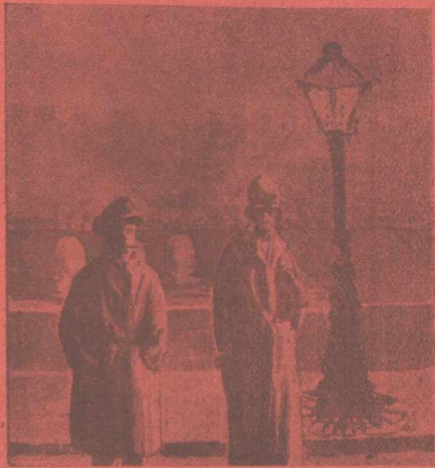
... Μία γυναίκοβλα με κομψή σιλουέττα, βάδιζε μπρός από μένα σὲ μιὰ γέφυρα τοῦ Σηκουάνα, κατὰ τὸ ΚαστιέΛατέν..