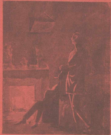
... Ἡ Ζοζετα ἄργισε νὰ γόνιται... Ἐγὼ κοιμήθηκα χαπλωμένος στὴν πολυθρόνα μου ..