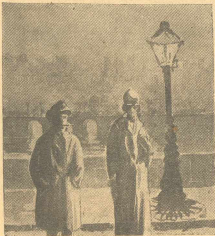
... Μιὰ γυναικοῦλα μὲ κομψὴ σιλουέττα, βάδιζε μπρὸς ἀπὸ μὲνα σὲ μιὰ γέφυρα τοῦ Σηκουάνα, κατὰ τὸ Καρτιέ Λατέν...

Πολλὲς φορὲς θέλησα νὰ συζητήσω μὲ τὸν ἑαυτό μου ἂν μιὰ γυναῖκα ποὺ κυλιέται στὸ βουρκο τῆς πορνείας, κυλιέται ἀπὸ ἀνάγκη ἢ ἐπειδὴ ἡ φύσις τῆς