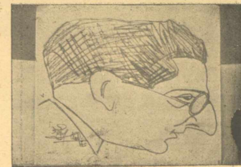
Ὁ ἄοκνος καὶ εὐελπὴς μαέστρος τοῦ Θιάσου