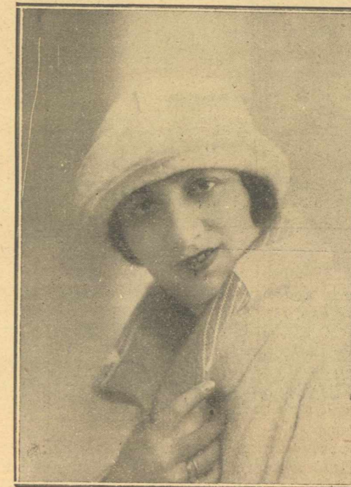
Φωνὴ γλυκεῖά, καὶ φυσιογνωμία εὐγενεστάτη· εἶνε τὰ τρία χαρίσματα μὲ τὰ ὁποῖα εἶναι προικισμένη ἡ συμπαθὴς καλλιτέχνης. Πρωταγωνιστεῖ εἰς τὰ Βιεννέζικα ἔργα, στὴ «Μπαγιαντέρα», στὴ «Κοντέσσα Μαρίτσα» καὶ ἐξαιρετικῶς εἰς τὴν «Φρασκονίτα».

Ἐξῆσε καὶ ζῆ μὲ τὴν μεγάλην ἰδέαν τῆς ἀνυψώσεως καὶ τελειοποιήσεως τοῦ μουσικοῦ μας θεάτρου. Καρτερικῶς ἐπάλασε καὶ παλαίει κατὰ τῶν ἀντιξῶν περιστάσεων καὶ πάντοτε νικητὴς κρατεῖ τὸ γόητρον τῆς Ἑλληνικῆς Ὀπερέττας στὸ ὕψος τῆς ἀποστολῆς τῆς.